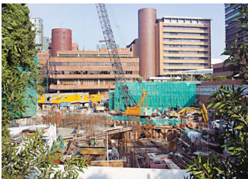
理大於去年9月已表示,第8期校舍及創新樓因建築工程比預期複雜,出現延誤。圖為當時仍在動工的工程地盤。

就工程延期落成,理大回應指該校第8期校舍及創新樓的建築工程比預期複雜,令施工進度受影響,按目前進度,兩者可分別於2012/13學年的第1個學期及第2個學期啟用。該校表示除會密切監察新校舍工程進度,又將制定一套短期過渡方案,包括延長平日上課時間及在周末上課,及使用校內綜合活動室、大型會議室、蔣震劇院,或租用鄰