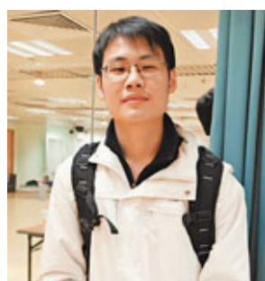
就讀浸大社會及通識教育系的翁同學認為,校方對於回答不了的問題充耳不聞。