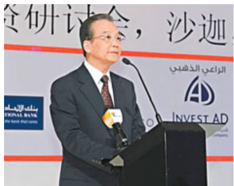
溫家寶在中阿合作論壇第四屆企業家大會暨投資研討會開幕式上講話。

綜合新華社及中新社18日電 溫家寶總理18日出席在阿聯酋沙迦舉行的中阿合作論壇第四屆企業家大會暨投資研討會開幕式並講話。他指出，這次訪問海灣國家，中國與沙特、阿聯酋兩國政府在經貿、能源、基礎設施建設、金融、人文等各領域達成10多項合作協議，其中經貿合作協議涉及金額達1,000億元人民幣左右。在結束對阿聯酋的訪問後，溫家寶開始對卡塔爾進行正式訪問，這是兩國建交以來，中國總理首次訪卡。