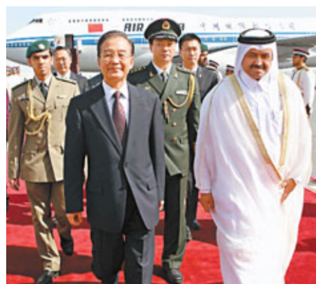
18日，溫家寶抵達多哈，開始對卡塔爾進行正式訪問。

當日中午，溫家寶抵達卡塔爾首都多哈，開始對卡塔爾進行正式訪問。在機場，我將會見哈馬德埃米爾、塔米姆王儲，並同哈馬德首相兼外交大臣舉行會談，就中卡關係及共同關心的國際和地區問題交換意見。我相信，這次訪問將進一步增進中卡兩國人民的相互了解和友誼，推動新時期中卡關係發展取得更加豐碩的成果。