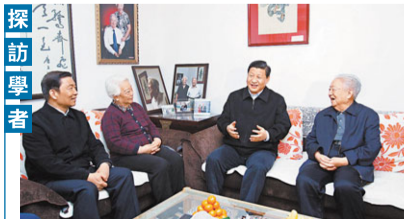
1月18日，中共中央政治局常委、中央書記處書記、國家副主席習近平分別來到國家最高科技獎獲得者徐光憲院士和閔恩澤院士家中，代表胡錦濤總書記和黨中央親切看望兩位著名專家學者，向他們致以誠摯的問候和新春的祝福。圖為習近平與中國科學院院士、中國工程院院士閔恩澤(右一)親切交談。