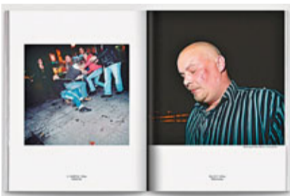
雜誌內的各個專欄都有一個共同主題。

已經很少見。《攝影之聲》的提問使得每一個攝影師都不再只是旁觀的影像紀錄者，這些發問也同時界定拍攝成為一種介入行動。「這種創作同時也是一種社會參與及對話，它必須有一些突破與表達。透過這張照片，鏡頭背後的人在想甚麼，最重要的是，他的體會如何透過照片作為一種語言訴說出來。」