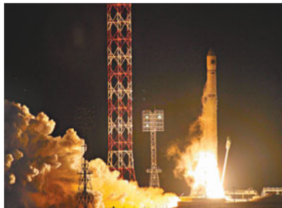
俄運載火星探測器「福布斯-土壤」火箭升空一刻。資料圖片

俄羅斯昨日稱，日前墜落地球的俄羅斯火星探測器「福布斯-土壤」，可能受到美國雷達的輻射影響以致失靈，未能脫離地球軌道飛往火星。 俄羅斯聯邦航天局 (Roscosmos) 前局長、現任俄羅斯國營技術公司科學委員會主席科普托夫說：「這理論是存在的。為測試這理論，我們需將一個與火星探測器相似的設備，暴露在美國雷達輻射的環境中。」 俄副總理羅戈津昨日稱，俄航天局的太空任務失敗個案，絕大多數是因上世紀90年代資金匱乏，以致生產不少有缺陷的設備所帶來的後遺症，「但若證實外國影響我們的太空設施，我們可能會得出截然不同的結論。」 俄航天局現任局長波波夫金上週公開質疑，「為何俄國太空船總在西半球上空失靈？」認為可能有外國勢力「搞鬼」。 ■法新社