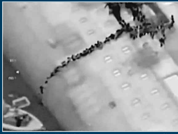
乘客遇難時游繩至救生艇逃生。

意大利郵輪「協和號」觸礁翻側，當局昨日公布失蹤人數突然增加近一倍，指有25名乘客及4名船員仍然失蹤。隨着出事海域天氣轉壞，搜索行動一度中斷數小時。當局昨日在船身進行爆破，使消防員和潛水員能進入船內。現時郵輪隨着海浪漂移，當局擔心若郵輪一下子滑至深海，船上2,300噸燃油可能大規模洩漏，勢必造成嚴重生態災難。