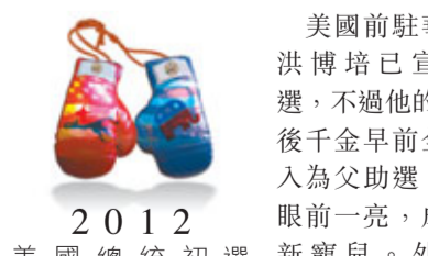
2012 美國總統初選 新寵兒。外界估計，她們可能步前總統克林頓及布什女兒的後塵，加入電視圈工作。