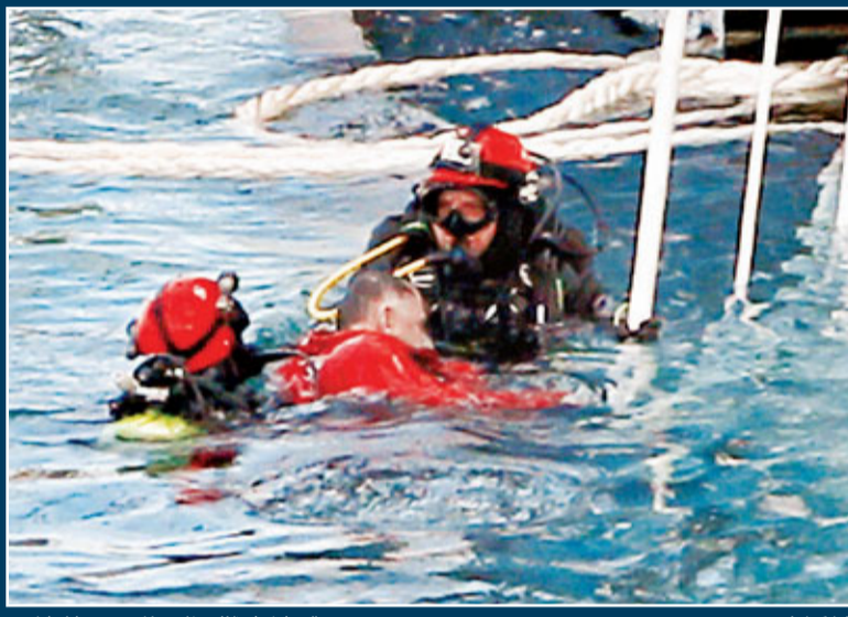
搜救員尋找到遇難者遺體。