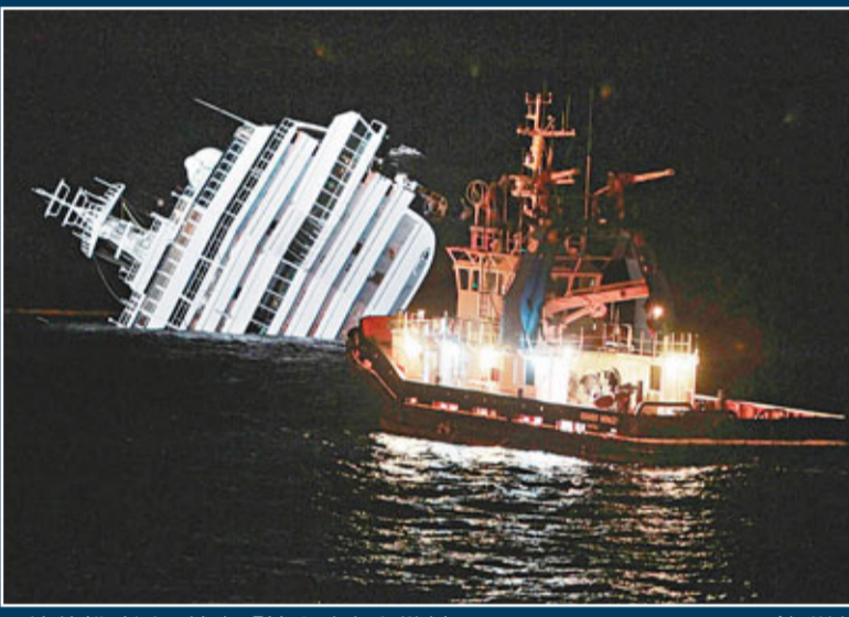
搜救船駛近，抽走「協和號」上燃料。