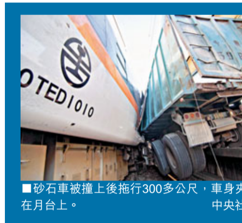
砂石車被撞上後拖行300多公尺，車身夾在月台上。