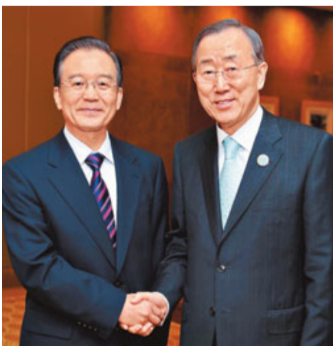
■16日，國務院總理溫家寶在阿布扎比會見聯合國秘書長潘基文。

香港文匯報訊 據中通社報道，中國國務院總理溫家寶16日在阿布扎比會見聯合國秘書長潘基文時表示，中方支持聯合國和秘書長在國際事務中發揮更大作用，取得更大成功。