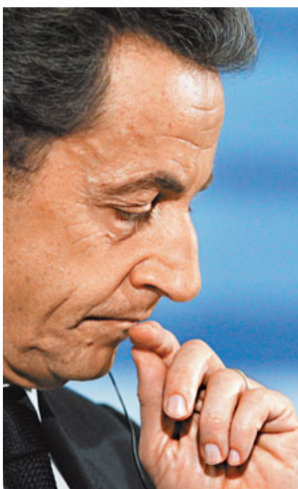
法國總統薩科齊訪西班牙，警告歐洲面臨「空前」危機，歐元區必須加強競爭力。

中國經濟增長勝預期，加上德國投資者信心回復，帶動美股昨日早段急升過百點。道瓊斯工業平均指數早段報12,533點，升111點；標準普爾500指數報1,299點，升9點；納斯達克指數報2,735點，升25點。歐洲股市造好。英國富時100指數中段報5,681點，升23點；巴黎CAC指數報3,248點，升23點；德國DAX指數報6,304點，升84點。沙特望油價維持100美元 沙特阿拉伯稱希望本年油價維持在每桶100美元水平，紐約2月期油昨升穿100美元，升1.94美元，報100.63美元。