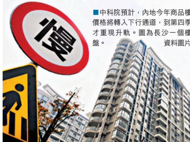
■中科院預計,內地今年商品樓價格將轉入下行通道,到第四季才重現升軌。圖為長沙一個樓盤。

報告認為,樓價調控非常必要,但應逐步減少行政手段干預,更多以稅收等市場經濟手段調控。此外,報告還認為,房價應當回歸合理,但回歸幅度必須適度,若調控不當,房價的過度回歸將不利於中國經濟平穩發展。