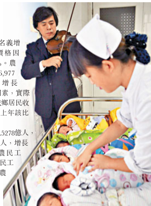
■內地去年出生人口1,604萬人,出生率為1.193%。圖為襄陽市一醫院新生嬰兒區。

全年農民工總量2.5278億人,比前年增加1,055萬人,增長4.4%;其中本地農民工9,415萬人,外出農民工1.5863億人。外出農民工月均收入2,049元,比前年增長21.2%。