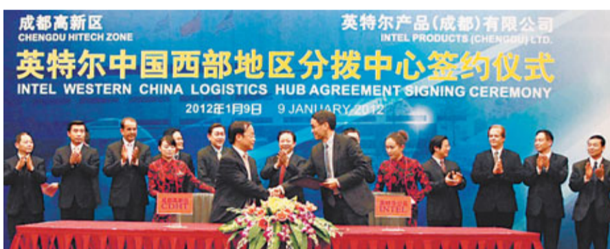
英特爾中國西部地區分撥中心落戶成都高新區,圖為簽約儀式。

香港文匯報訊(記者張楚 成都報導) 英特爾成都芯片封裝測試廠第10億顆芯片日前下線,這是成都工廠的累計生產量全新的里程碑。同時,英特爾宣佈英特爾中國西部地區分撥中心落戶成都高新區,以進一步優化英特爾的供應鏈,提升對OEM物流響應速度。