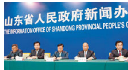
山東省政府新聞發佈會。

香港文匯報訊(記者殷江宏 山東報導) 記者從山東省政府新聞發佈會獲悉,第七屆中國(荷澤)農資交易會將於2月23日在荷澤市中國林業展館開幕,交易會將吸引魯蘇浙豫皖五省農資經銷商,以及眾多國內外農資企業參觀洽談。