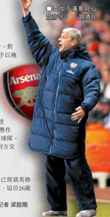
■雲加不滿意阿仙奴防守。