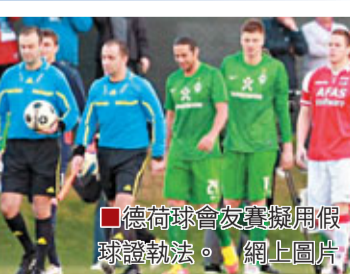
■德荷球會友賽疑用假球證執法。網上圖片

在假球證的執法下，這場比賽出現了極具爭議的12碼，傷停補時達到了驚人的10分鐘。賽後，雲達不來梅體育主管阿洛夫斯馬表示，「我不希望這場比賽背後存在着什麼東西。」據知，至少有9個著名的莊家對雲達不來梅的這場比賽下了注，還有大量來自亞洲方面的投注。