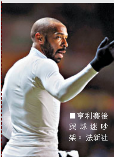
■亨利賽後與球迷吵架。

英超班馬史雲斯於周日聯賽，憑史葛洗佳亞、尼敦戴亞和丹尼格拉威各入1球，主場3:2技術性擊倒阿仙奴，兵工廠同時亦錄得兩連敗，被第4的車路士拋離4分。阿仙奴主帥雲加表示，脆弱的防線已經成為了兵工廠衝擊聯賽好成績的最大短板。