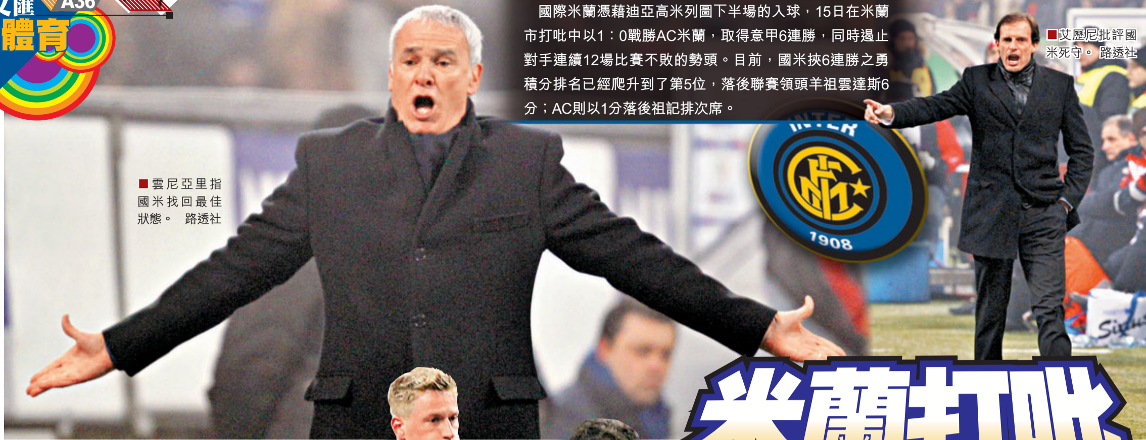
■雲尼亞里指國米找回最佳狀態。