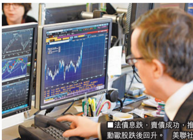
法債息跌，賣債成功，推動歐股跌後回升。美聯社

正訪問希臘的德國外長韋斯特韋勒日前稱，歐洲是時候展現有能力對抗由美國主導的評級機構，自行創立獨立評級機構。他特意以英語發表聲明，稱歐洲建立評級機構，才是恢復市場信心的唯一方法。 意總理蒙蒂表示，歐元區管治不足，是被標普降級的主要原因。 法國與奧地利3A評級遭標普摘掉，德債成為歐債危機下的避風港，展現空前吸引力，兩年期債息由去年高位1.95厘暴跌至0.134厘；5年期亦在0.75厘徘徊；10年期僅1.77厘，遠低於其他歐元區國家。 ■路透社/法新社 美聯社/彭博通訊社