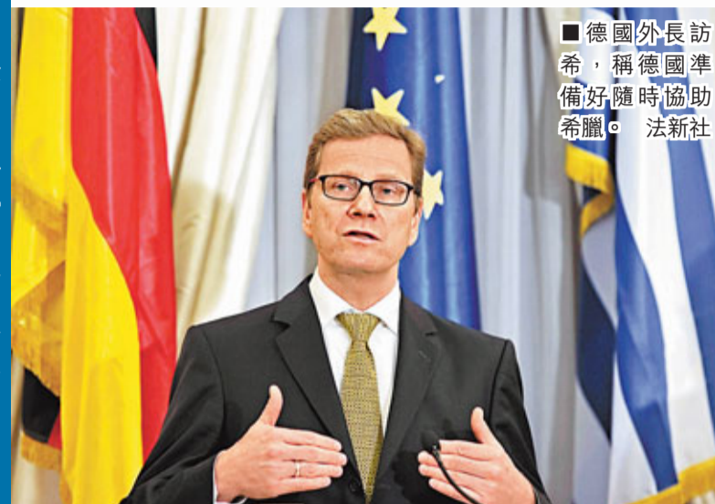
德國外長訪希，稱德國準備好隨時協助希臘。

債王警告希臘會出事 太平洋投資管理公司(Pimco)創辦人、「債王」格羅斯在推特twitter稱，標普降級顯示國家隨時會違約，警告「希臘會是下一個」。德國外長韋斯特韋勒則對希債問題樂觀，稱德國準備好隨時協助。愛爾蘭經濟學家布魯哈昨接受新華社專訪，稱今年不會有國家退出歐元區，因復用舊貨幣並不現實。 ■路透社/彭博通訊社/英國《金融時報》/CNBC/新華社