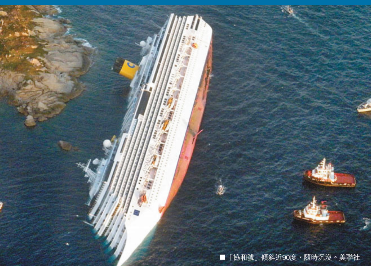
「協和號」傾斜近90度，隨時沉沒。