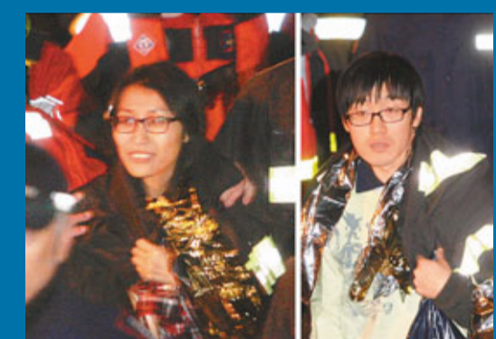
度蜜月的韓籍夫婦獲救。