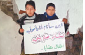
敘國兒童控訴政府軍摧毀家園。

敘利亞政府鎮壓示威多月，有變節士兵聲稱親眼看見上級斬下7月大嬰兒的頭，並將頭掛在門外，威脅懷疑窩藏反對軍的目標自首，否則以同樣方式處決他的其他孩子。