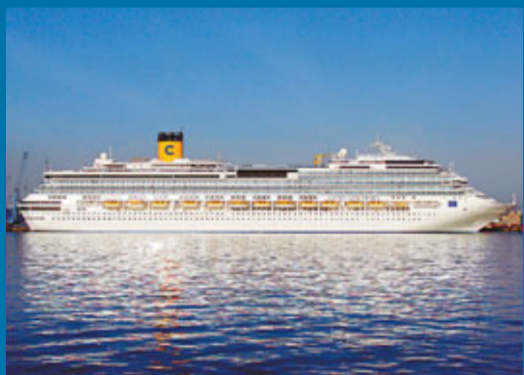
「協和號」事故可能打擊郵輪業。