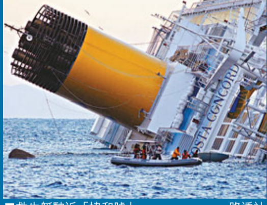
救生艇駛近「協和號」。