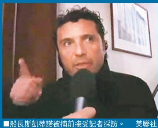
船長斯凱蒂諾被捕前接受記者採訪。

意大利豪華郵輪「協和號」搜救工作接連傳來好消息。海難發生近一天後，救援人員成功救出3名生還者，包括一對正度蜜月的韓籍新婚夫婦，以及一名意大利籍船員。蛙人昨日在郵輪尾部入水位置，發現兩具男性長者屍體，令事件死亡人數增至5人，尚有15人仍然失蹤。郵輪船長斯凱蒂諾前日被意國當局以過失殺人、擅自棄船和疏忽職守等罪名拘捕，罪成可被判入獄。