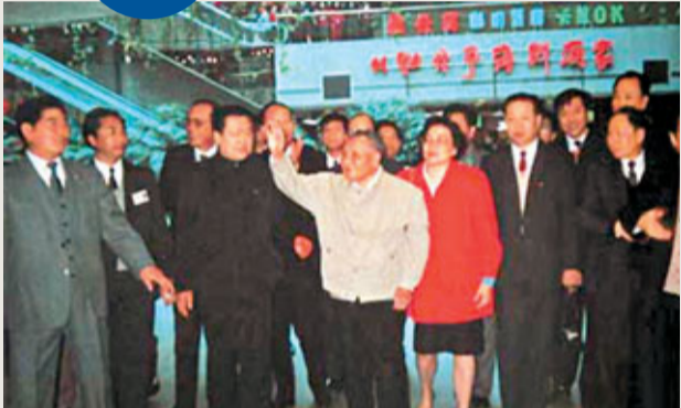
鄧小平到深圳國貿大廈參觀。 網上圖片