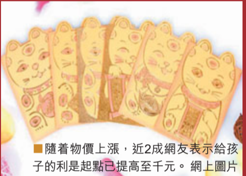
隨着物價上漲，近2成網友表示給孩子的利是起點已提高至千元。

說，她雖然在長春工作，但親友多在瀋陽，所以每年春節回家都要為晚輩準備年利是。據她介紹，家中算上孫子、孫女一共有4個孩子，一個孩子包500元錢，一共就要2000元。「現在生活水平提高了，覺得二三百元的紅包有點拿不出手了。」 ■《城市晚報》