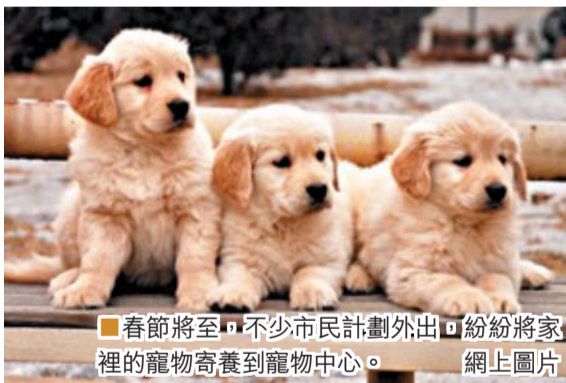
春節將至，不少市民計劃外出口紛紛將家裡的寵物寄養到寵物中心。

記者看到，廈門知名論壇某私人代養帖子標榜「單犬單間」的貴賓式服務，點閱率頗高。該帖稱，將為每隻寵物提供單間10平米「豪宅」散養模式，更有專業人士對寵物進行護理和陪伴玩耍。相比寵物機構單純收貓、狗寵物，一些私人代養主業務更加廣泛，鸚鵡、鴿子，以及金魚和倉鼠，皆可代養，且價位不高。不過，目前廈門私人代養多位於居民區，衛生條件堪憂，寵物種類較雜，增加了發生交叉感染的幾率。