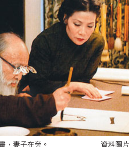
■張大千作畫,妻子在旁。 資料圖片

「藝品價格」追蹤45萬名以上畫家的作品拍賣情形,價位改變反映出中國在全球藝術市場的實力日增。「藝品價格」指出,去年全球藝術品拍賣的成交總額約為110億美元,中國佔39%,較前一年佔33%有所增加。美國排名第二,佔25%。