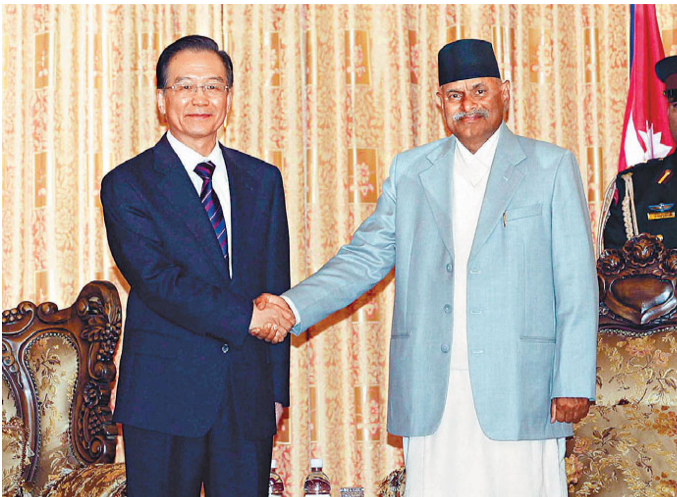
■14日,國務院總理溫家寶在加德滿都會見尼泊爾總統亞達夫。

溫家寶當日會見尼泊爾總統亞達夫。他首先轉達胡錦濤主席的親切問候和良好祝願。溫家寶表示,中方願與尼方保持高層交往,深化政治互信,擴大互利合作,推進水電開發、交通基礎設施建設等重點領域合作。中方支持尼泊爾與周邊國家發展友好關係,雙方要密切在國際和地區事務中的協調與配合,促進本地區穩定與發展。