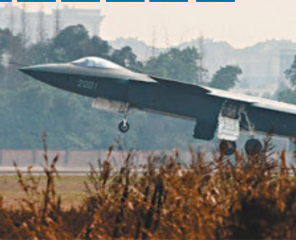
■13日中午1點左右,網友拍攝了在成都在某機場進行2012年首次試飛的殲-20戰鬥機技術驗證機,足見殲-20戰機的環球頻率高和工作任務的緊張程度。