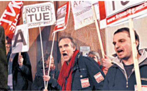
■法國左翼人士在巴黎標普辦公大樓外抗議標普降法評級。