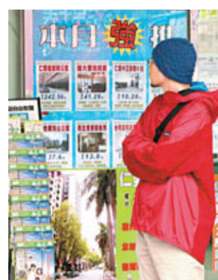
台灣民眾購買房地產總指數為78.34，兩岸四地中最高。絕對指數仍較低，亦表明民眾對通脹仍信心不足。值得注意的是，投資股票時機指標跌幅最大，總指數為78.27，較上一季的調查下降9.48，與2010年同期相比，跌幅更是達到45.8；在四地中跌幅最大。其中四季度現況滿意度為81.70，較上一季的調查下降7.03，未來信心度為75.98，較上一季的調查下降11.1%。

此外，物價方面的消費者信心分指數，無論同比還是環比均有上升，體現台灣民眾對物價狀況的擔憂程度正在降低，但其