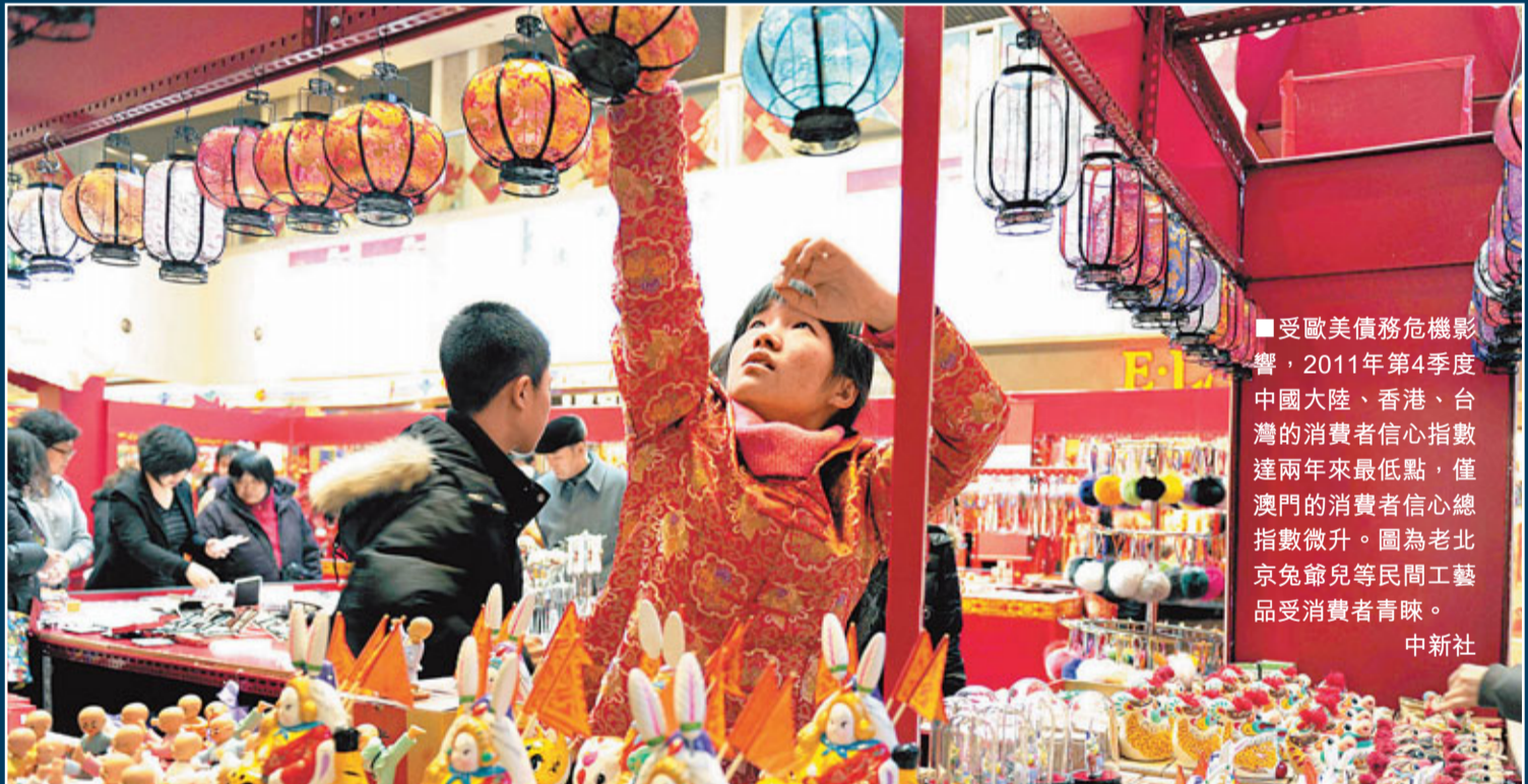
受歐美債務危機影響，2011年第四季中國大陸、香港、台灣的消費者信心指數達兩年來最低點，僅澳門的消費者信心總指數微升。圖為老北京兒童等民間工藝品受消費者青睞。

香港文匯報訊(記者 劉曉靜、趙一存北京報道)由兩岸四地大學定期公佈的兩岸三地消費者信心指數顯示，受歐美債務危機影響，去年第4季度，兩岸四地中僅澳門的消費者信心總指數微升2.2達86.9。大陸、香港和台灣的消費者信心總指數則分別為90.4、79.3和69.8，同比略有下降，持續低於100點的中性線。