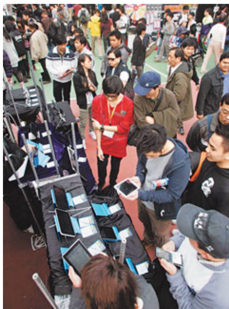
在通脹陰影之下，港人對物價狀況最欠缺信心，整體分指數為57.4。

曹國輝指出，受歐債危機等影響，港人對經濟發展信心不足，尤其表現在投資股票方面。至於未來走勢，因大多港人在繼續觀望歐洲經濟危機是否惡化，所以，暫時仍不會投資股票，投資指數亦不會有太大改變。