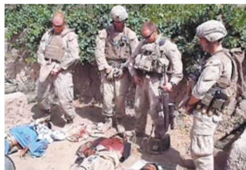
■網上流傳美軍侮辱塔利班士兵屍體的片段。

網上近日流傳一段美軍海軍陸戰隊員羞辱塔利班士兵的片段，片中4名美兵於營外向3具塔利班士兵屍體撒尿，其間不斷歡呼及說出侮辱字句。五角大樓發言人形容片段內容令人「反胃」，矢言徹查事件。塔利班發言人則指美軍行為「野蠻」，事件恐令伊拉克及阿富汗等地反美情緒升溫。