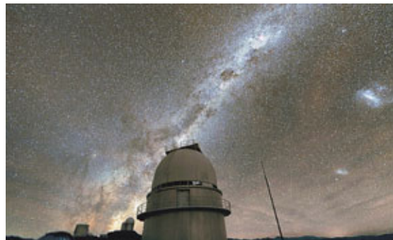
■去年在智利拍攝的銀河影像。

夜空中無數星星閃爍，周圍看似黑暗無物，卻可能存在大量行星。英國《自然》雜誌最新研究報告稱，銀河系中可能存在千億行星，其中或包括數十億顆與地球條件相似而適合生命生存的行星。