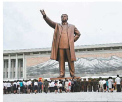
■朝鮮將會樹立金正日銅像。圖為平壤的金日成銅像。

朝鮮官方通訊社朝中社報道，朝鮮勞動黨中央委員會政治局昨日發布特別公報說，朝鮮將永久保存已故最高領導人金正日的遺體，並為其樹立銅像。