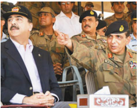
■吉拉尼(左)與卡亞尼(右)於2010年共同觀看軍事演習。