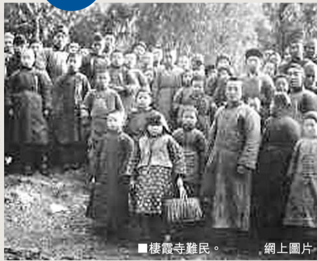
樓震寺難民。

1937年12月13日，南京淪陷。拉貝和喬治·費奇立刻來到安全區最南邊的漢中路同日軍交涉。費奇在地圖上用鉛筆畫出標記，告訴日軍安全區的位置。日本軍官說：「請放心！」拉貝和費奇以為真。沒想到他們還未離開，就親眼看到日軍擊斃20名驚慌逃跑的難民。接着日軍又闖進安全區，強行抓走大批已解除武裝的中國士兵。