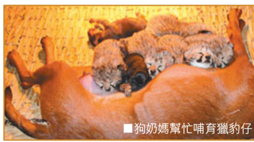
狗奶媽幫忙哺育獵豹仔。