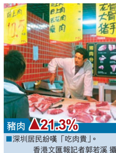
豬肉漲21.3% 深圳居民紛嘆「吃肉貴」。

間內豬肉單價仍會穩定在高位。市民胡先生則戲稱現在的CPI應為「Chinese Pig Index」(中國豬肉指數),希望每次在物價變動時,政府能夠出面,通過限價、補貼等方式維護市民的利益。