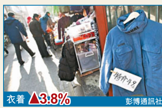
衣着漲3.8% 彭博通訊社

香港文匯報訊(記者 海巖 北京報道)國家統計局昨日公佈,去年12月,全國工業生產者出廠價格(PPI)同比上漲1.7%,為2009年12月以來新低,環比下降0.3%。工業生產者購進價格同比上