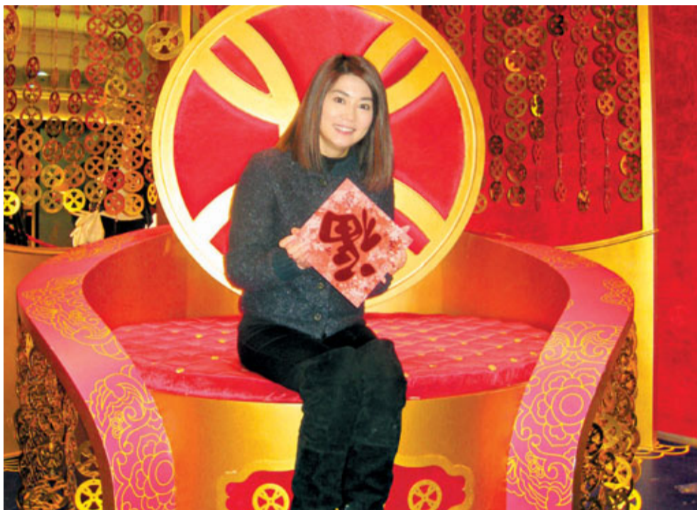
時代廣場董事凌緣庭估計,春節期間時代廣場的營業額升20%,內地客比例升至35%。

雖然外圍經濟不明朗,去年時代廣場的營業額達91億元,勁升21%,比去年初預期升15%為佳;內地客比例約佔30%,商場租金收入17.15億元,按年升12%。她預料,今年時代廣場的營業額升23%至24%。