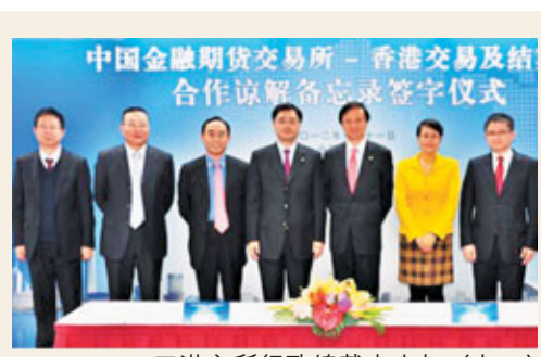
■港交所行政總裁李少加(右三)與中國金融期貨交易所(中金所)昨日就相互合作及資訊互換簽訂合作備忘錄。其他港交所及中金所的高層代表亦有出席及見證有關儀式。