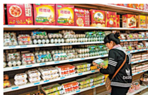
■市場預測去年12月份CPI將回落至4%。

香港文匯報訊(記者 卓建安) 內地於今日公布去年12月份通脹數字，綜合機構預測當月CPI將回落至4%。四大行今年首三天新增貸款500億，較2009年至2011年1月份的兇猛投放，有關投放稍顯溫和。目前市場關注內地通脹回落，中央會否放鬆銀根。