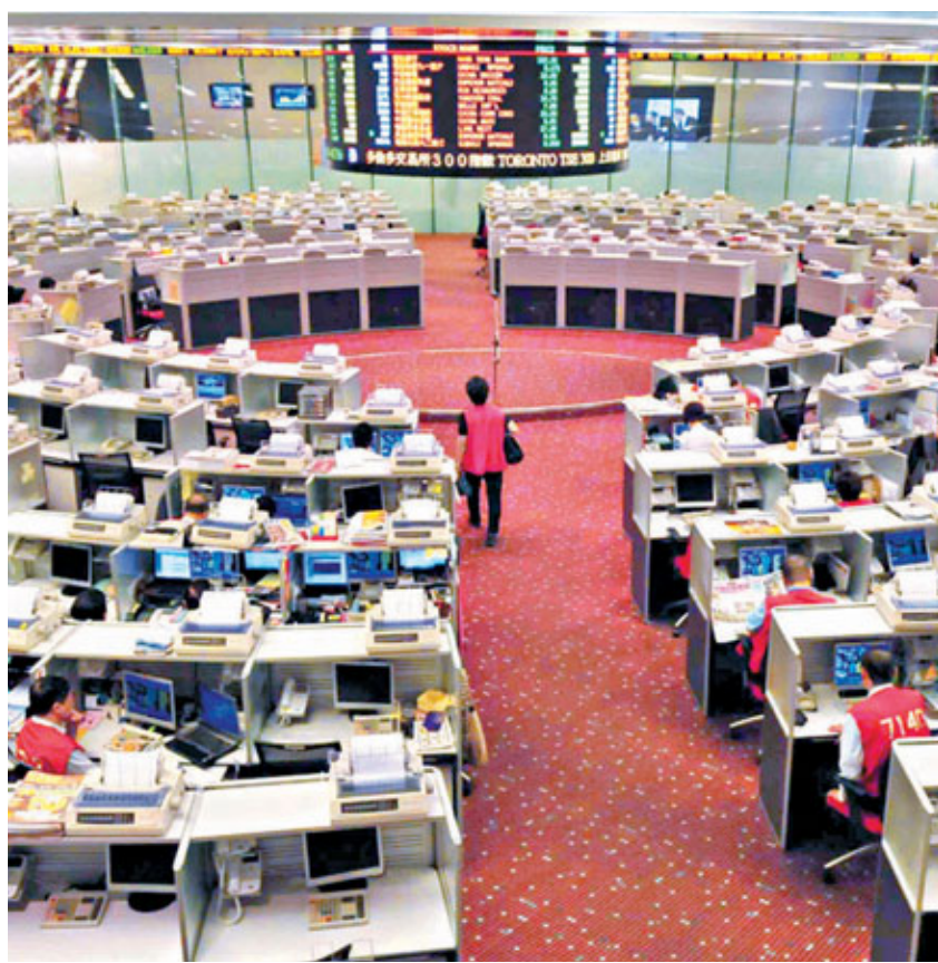
■證券業界宣布今日下午收市後，發起規模最大的千人大遊行。