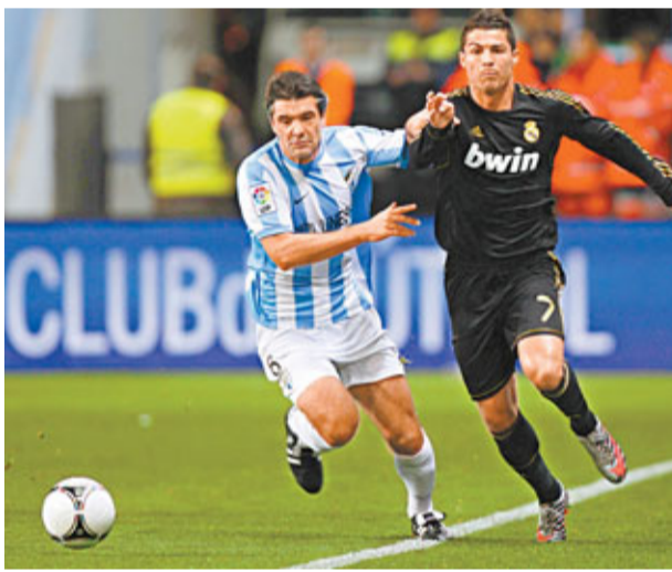
馬拉加中場杜拿蘭(左)力阻C朗(右)前進。

巴塞羅那上輪聯賽剛與同市對手愛斯賓奴踢成1:1，8連勝走勢告終。最新有右翼丹尼爾受傷的他們今晚西班牙盃16強次回合作客對近3場不勝的奧沙辛拿(now632台周五凌晨5a.m.直播)，由於首循環已大勝4:0，相信巴塞是役未必會精銳盡出。 剛成就金球獎(世界足球先生)3連霸的前鋒美斯(左圖)是役或會被巴塞收起。歐洲足聯主席柏天尼(右圖)表示，美斯必須協助阿根廷贏得世界盃，才能比肩比利和馬拉當拿：「不論贏還是不贏得世盃，美斯都是偉大球員，但世盃有特別的意義，會留在人們的意識裡。當你提及馬拉當拿，你會想到他在1986年世盃的表現。」美斯之前在世盃的最好成績只是8強。另外，阿根廷足總宣布，阿根廷國足與巴西隊將於今年6月9日在美國新澤西州上演一場「巔峰對決」。 ■香港文匯報記者 梁志達