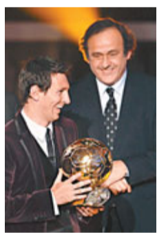
美斯(左)是役或會被巴塞收起。歐洲足聯主席柏天尼(右)表示，美斯必須協助阿根廷贏得世界盃，才能比肩比利和馬拉當拿。 香港文匯報記者 梁志達

巴塞羅那上輪聯賽剛與同市對手愛斯賓奴踢成1:1，8連勝走勢告終。最新有右翼丹尼爾受傷的他們今晚西班牙盃16強次回合作客對近3場不勝的奧沙辛拿(now632台周五凌晨5a.m.直播)，由於首循環已大勝4:0，相信巴塞是役未必會精銳盡出。 剛成就金球獎(世界足球先生)3連霸的前鋒美斯(左圖)是役或會被巴塞收起。歐洲足聯主席柏天尼(右圖)表示，美斯必須協助阿根廷贏得世界盃，才能比肩比利和馬拉當拿：「不論贏還是不贏得世盃，美斯都是偉大球員，但世盃有特別的意義，會留在人們的意識裡。當你提及馬拉當拿，你會想到他在1986年世盃的表現。」美斯之前在世盃的最好成績只是8強。另外，阿根廷足總宣布，阿根廷國足與巴西隊將於今年6月9日在美國新澤西州上演一場「巔峰對決」。 ■香港文匯報記者 梁志達