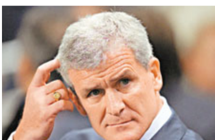
曉士要帶隊護級。

英超球會昆流(昆流)任命曉士為球隊的新任主帥，雙方簽約兩年半。據報道，昆流的馬來西亞富豪老闆費南迪斯會給予曉士2000萬英鎊(約2.4億港元)買新球員。