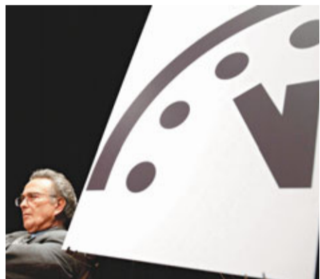
距離象徵末日的午夜僅剩5分鐘。法新社

然而，BAS表示，情況如今出現倒退，全球面對的核危機非常明顯，加上氣候變化、尋找可持續及安全新資源一直面臨挑戰，加上各國領袖以國家商業發展作為主要考慮，拒絕為減排妥協，都是末日鐘推前的考慮因素。 ■《每日郵報》/法新社