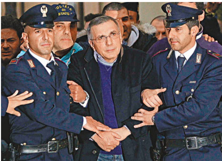
意大利警方上月拘捕黑手黨頭目扎加里亞。

報告指黑手黨收入來源中，以毒品交易佔首位，收入約650億歐元，高利貸及產業廢棄物等垃圾非法處理也分別佔160億歐元