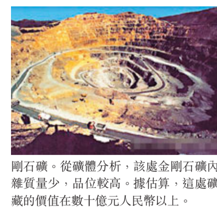
剛石礦。從礦體分析,該處金剛石礦內雜質量少,品位較高。據估算,這處礦藏的價值在數十億元人民幣以上。

香港文匯報訊 據中新社電,遼寧省瓦房店地區發現的一處大型金剛石礦(見圖),礦藏量保守估計約100萬克拉(約合200公斤),可開採30年以上。遼寧省地質礦產調查局局長于文禮11日在此間舉行的遼寧省政協會上透露了這一消息。