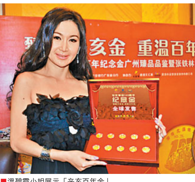
溫碧霞小姐展示「辛亥百年金」

現場展出的「辛亥百年金」受到羊城市民的青睞,特號藏金的公益拍賣,更引起收藏愛好者的火熱競藏。編號為888的「辛亥百年紀念金」10g套裝金章,經過十幾個回合的競價,最終被神秘顧客以71.88萬元拍走,成為當天活動的最大亮點。為支持公益事業,溫碧霞小姐為市民現場簽售;張鐵林先生則現場揮毫,為公益拍賣的買受者贈送了墨寶。