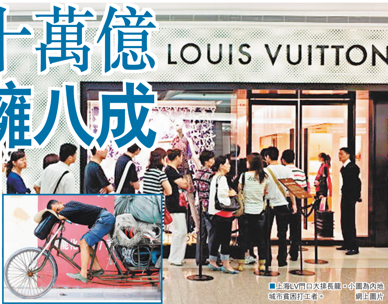
上海LV門口大排長龍。小圖為內地城市貧困打工人。

他認為,產生這種偏差,原因是國家統計局進行城鄉居民住戶調查時,一部分高收入居民報給統計局的收入往往偏低,此外調查常被高收入居民拒絕,造成最後抽樣丟失了相當數量高收入居民的樣本。為此,王小魯重新設計了統計方案。據他自建的模型推算出,2008年,全國居民隱性收入總規模為9.3萬億元。其中,隱性收入的80%集中在收入最高的那20%的家庭裡面,其中最高端的10%就佔了隱性收入的62%。全國居民最高收入的10%家庭和最低10%家庭的人均收入之比是65倍,而非統計數據顯示23倍左右。