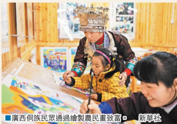
廣西侗族民眾通過繪製農畫致富。

香港文匯報訊 據新華網報道,國家統計局10日發佈公告對2010年國內生產總值(GDP)進行最終核實,2010年GDP現價總量為401,513億元,比初步核實數增加了311億元,按不變價格計算,比上年增長10.4%,與初步核實數據維持不變。本月17日國家統計局即將發佈2011年的國民經濟運行情況,各方普遍預計內地2011年GDP增速將超過9%,至於剛剛開局的2012年,則有預測表示GDP增長率將超8%。