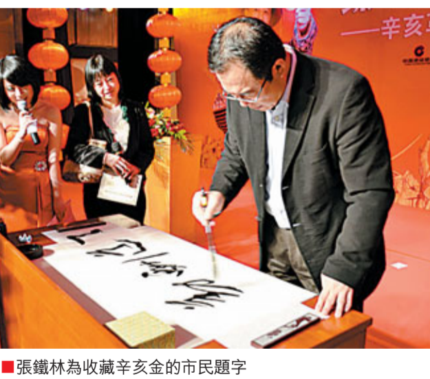
張鐵林為收藏辛亥金的市民題字

近日,中國建設銀行廣東省分行在羊城舉辦了「辛亥百年紀念金」品鑒會,分別參演過「紀念辛亥革命100周年」題材影視劇的張鐵林、溫碧霞兩位影視明星應邀出席了活動,現場給力「辛亥百年金章」公益拍賣。