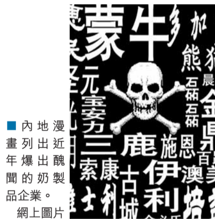
內地漫畫列出近來年爆出的奶製品企業。網上圖片