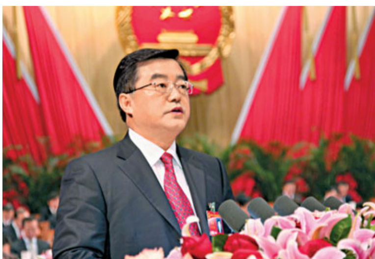
張慶偉稱，河北沿海地區上升為國家戰略是重大機遇。

張慶偉 介紹，今年將着力實施「十百千工程」，努力建設工業強省。堅持抓優勢產業和強勁企業，培育壯大曹妃甸精品鋼、保定汽車及零部件等十大工業基地；扶持發展百家優勢企業，打造產業龍頭；培育千項省級以上品牌產品，支持企業育名牌、創品牌、正品牌。與此同時，實施千項技改項目，抓好鋼鐵工業、裝備製造業及石化產業改造，推進建築、建材、輕工、食品、紡織、醫藥等產業的改造升級。 河北還將啟動戰略性新興產業發展專項資金，加快石家莊國家生物產業、保定國家新能源、廊坊電子信息、邢台光伏、邯鄲新材料、唐山動車組等高新技術產業基地建設，推進200個投資10億元以上大項目的謀劃和建設。