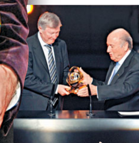
哥迪奧拿當選最佳教練可謂實至名歸。