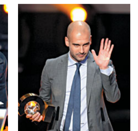
哥迪奧拿當選最佳教練可謂實至名歸。