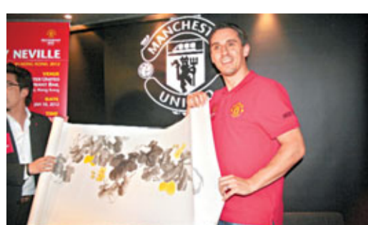
加利尼維利接過紀念品。

西甲只有兩支強隊，英超就「百家爭鳴」，賽事水準和可觀性高，常有未到最后一刻也不知有否意外戰果的情況。加利佬前天抵港並於昨午到尖沙咀曼聯餐廳和記者見面，並為一批球迷簽名兼共享晚宴，與香港的曼聯迷來了一次近距離接觸。