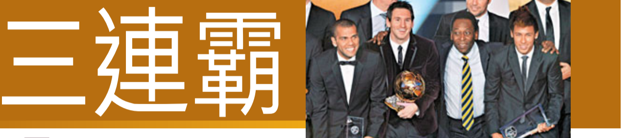
美斯(左二)跟巴西名宿比利(右二)、新星尼馬(右)和入選最佳陣容的巴塞隊友丹尼爾(左)合照。