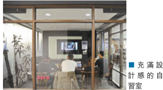
充滿設計感的自習室。

今年圖書館設計的「中國書法與經典文學」系列活動頗令他驕傲，手寫連心，他看到放下功利心進來感受和體驗中國書法的孩子們，手寫連心，是怎樣的沉醉在對中國傳統文字中樂而忘返。