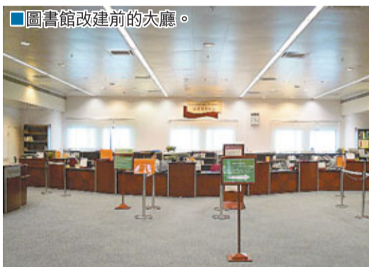
圖書館改建前的大廳。

「古籍修復不是我們小小一個圖書館能做到的。」景教授說，「我們和內地的兄弟大學進行合作分工，北京大學、浙江大學、中山大學和廈門大學，他們都有古籍部。每年我們都會交流一次。」另一邊，城大圖書館自己的編務組8位同事，也都抱著喜悅的心情迎接這個「禮物」，「古籍牽動著我們的文化使命。我們現在幫韓國國家圖書館的漢籍