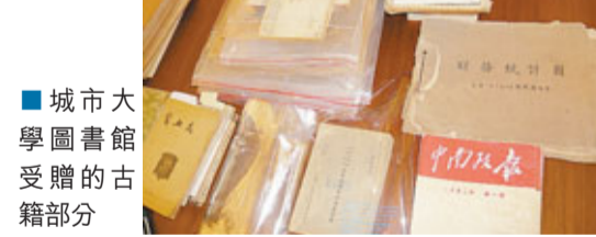
城市大學圖書館受贈的古籍部分