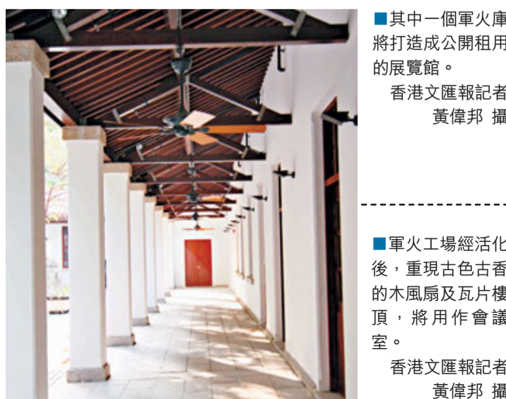
其中一個軍火庫將打造成公開租用的展覽館。