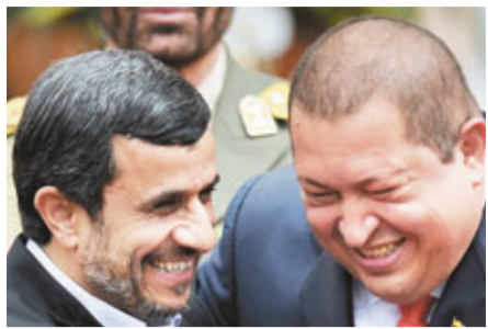
內賈德(左)和查韋斯(右)稱兄弟弟。