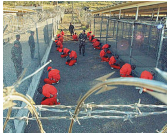
關塔那摩灣監獄內的拘留犯被嚴密監視。資料圖片

奧巴馬於2009年1月就任後，聲言要在一年內關閉監獄，數月後即改變態度，承認問題不易解決。國會共和、民主兩黨議員皆反對把恐怖分子疑犯遣返原籍受審或囚禁，亦反對把他們送到美國，上月底，奧巴馬簽署法案，禁止使用公帑轉移監獄疑犯到美國，變相下令無限期扣押他們。