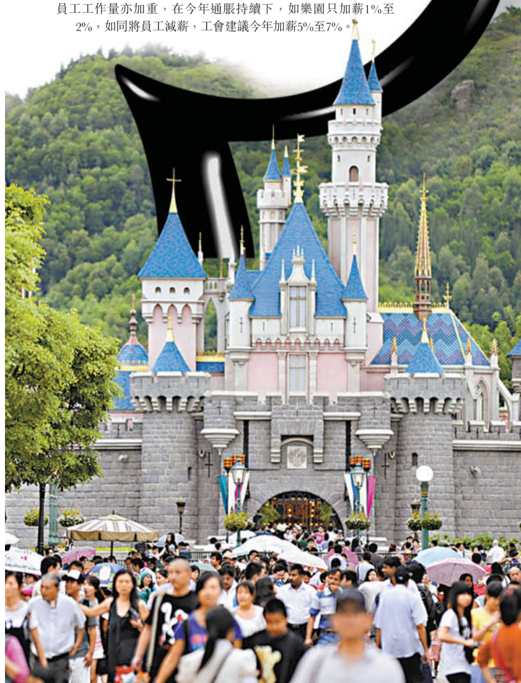
迪園上個財政年度稅前盈利增逾倍,入場人次590萬創新高。

他又指,迪士尼樂園地點遍遠,交通費不菲,加上樂園遊客大增,員工工作量亦加重,在今年通脹持續下,如樂園只加薪1%至2%,如同將員工減薪,工會建議今年加薪5%至7%。