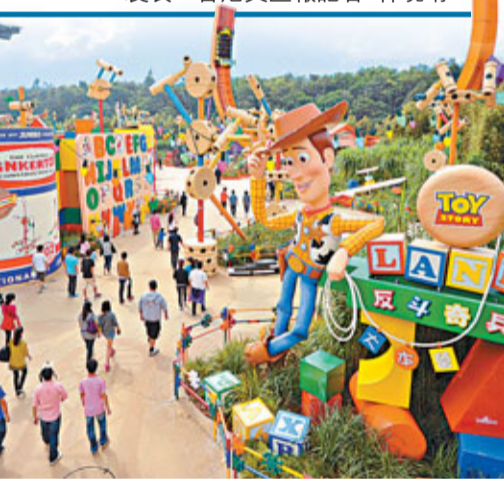
「反斗奇兵大本營」開放帶動入場人次。