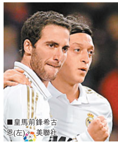
皇馬前鋒希古恩(左)。

皇家馬德里將在香港時間周三凌晨在西班牙盃16強次回合客場再戰馬拉加，在首回合領先3：2的皇馬，以其強勢相信晉級不難。(now632周三5a.m.直播)在上仗聯賽對CF格蘭納達時，實施馬提前因傷離場；據《阿斯報》透露，法國人只是被輕微撞了一下而已，他的傷勢並不嚴重。客戰對陣馬拉加，屆時主帥摩連奴將會在希古恩和賓施馬之間選擇單箭頭人選。另外，據西班牙《阿斯報》報道，皇馬教頭摩連奴計劃於冬季市場出售一位防線球員，目標人物直指表現欠佳的右後衛艾比路亞。此外，有消息指馬拉加已經盯上了德甲球會多蒙特的巴拉圭前鋒巴里奧斯，並預期1,000萬歐元就可以將該名前鋒歸隊旗下。香港文匯報記者 梁啟剛