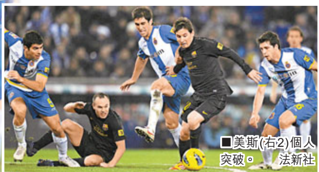
美斯(右2)個人突破。法新社

而荷蘭傳奇巨星告魯夫8日力挺巴塞球星美斯，稱其將在個人職業生涯中拿到7座金球獎。「美斯將成為歷史上捧得金球獎最多的球員。他將收穫自己的第5個、第6個乃至第7座金球獎。他無可比擬，他非比尋常。」究竟美斯能否奪得國際足協2011年「金球獎」，成為繼現任歐足協主席柏天尼之後，第1個連續3年獲此殊榮的人，相信大家留意今日新聞就可得到答案。香港文匯報記者 梁啟剛