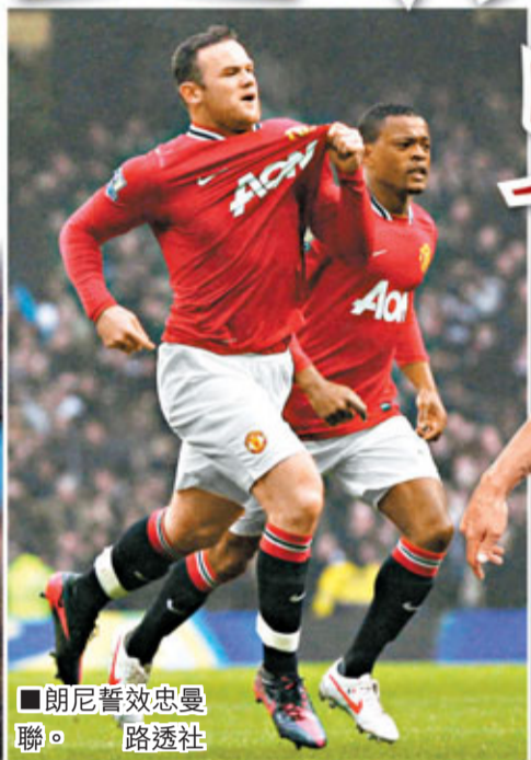
朗尼誓效忠曼聯。