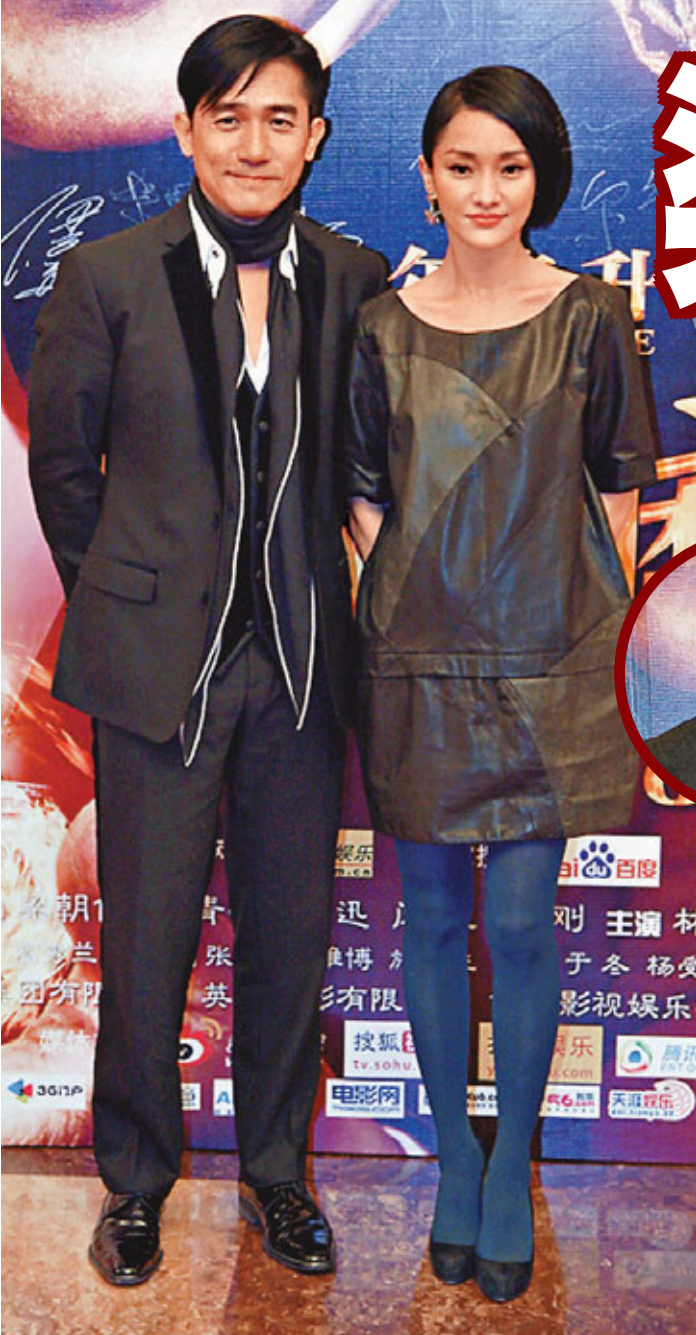
梁朝偉與周迅對自己的新作各有體會。

香港文匯報訊(記者 植植) 導演爾冬陞、影帝梁朝偉及劉青雲、周迅、閻妮、吳剛、王子義等前晚出席在北京政協禮堂舉辦的首映典禮晚會，現場環境熱鬧非常。首映禮上，徐克、鄭保瑞、連凱和尹子維等紅星紛紛到場支持。在兩個小時的時間裡，全場過千觀眾由頭笑到尾，看過後紛紛表示這才是合家歡的電影。