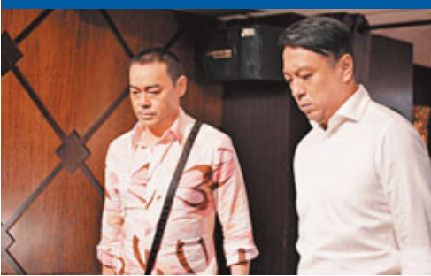
青雲(左)在《奪命金》有不錯表現。

香港文匯報訊 香港電影評論學會8日選出第十八屆「香港電影評論學會大獎」的五個獎項及七部推薦電影。此獎於每年率先頒發，被視為各電影獎項的風向儀。今屆經歷了長達八小時的激烈討論及三輪熱烈投票，葉德嫻眾望所歸，憑《桃姐》勇奪最佳女演員獎。劉青雲則以《奪命金》，第三次榮登學會大獎影帝。