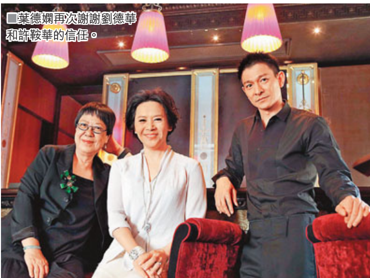
葉德嫻再次謝謝劉德華和許鞍華的信任。

葉德嫻回應說：「任何獎項都是一個鼓勵，對尤其老人家如我有如一枝強心針。但願所有獎項可為投資者取回應有回報，願許導演能再拍她相信的電影。謝謝香港電影評論學會，再次謝謝劉德華和許鞍華的信任。」姜文表示聽到這消息很開心，希望有時間來香港領獎。杜琪峯表示多謝電影評論學會，這部電影是由銀河創作組負責編劇部分，自從創辦銀作映像後，一直希望多給新人機會，為電影圈培育更多人才，希望大家共同努力。