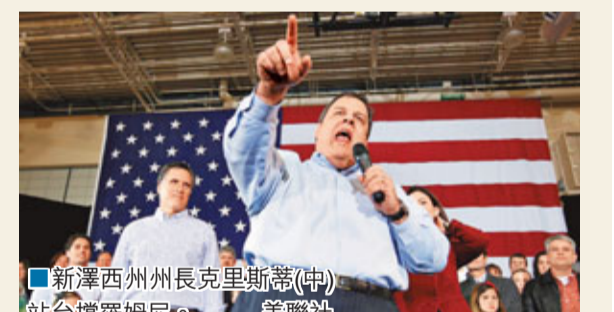
■新澤西州州長克羅斯蒂(中)站台撐羅姆尼。

美國共和黨今日在新罕布爾州舉行總統初選，於首仗艾奧瓦州黨團會議中領先的前麻省州長羅姆尼，於上周末的辯論中繼續被對手圍攻。然而，民調顯示他仍以35%支持率於新州大幅領先，並獲共和黨多位政治明星助選，包括新澤西州州長克羅斯蒂及前明尼蘇達州州長波倫等，料能輕鬆獲勝；政治預測市場InTrade更稱，他成為共和黨總統候選人的贏面高達83%。