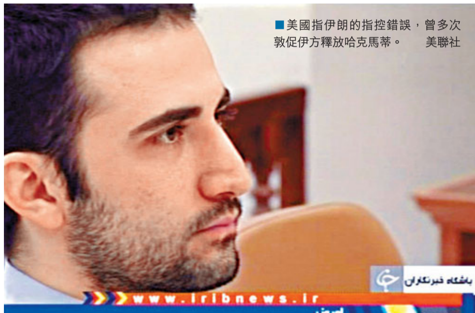
■美國指伊朗的指控錯誤，曾多次敦促伊方釋放哈克馬蒂。