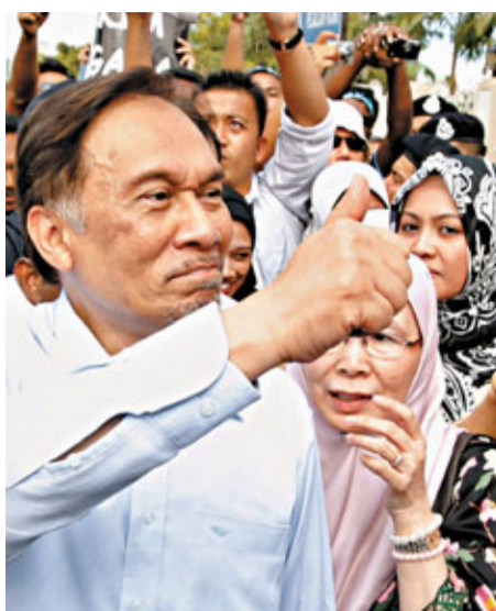
■獲判無罪的安華在法院外高舉拇指。