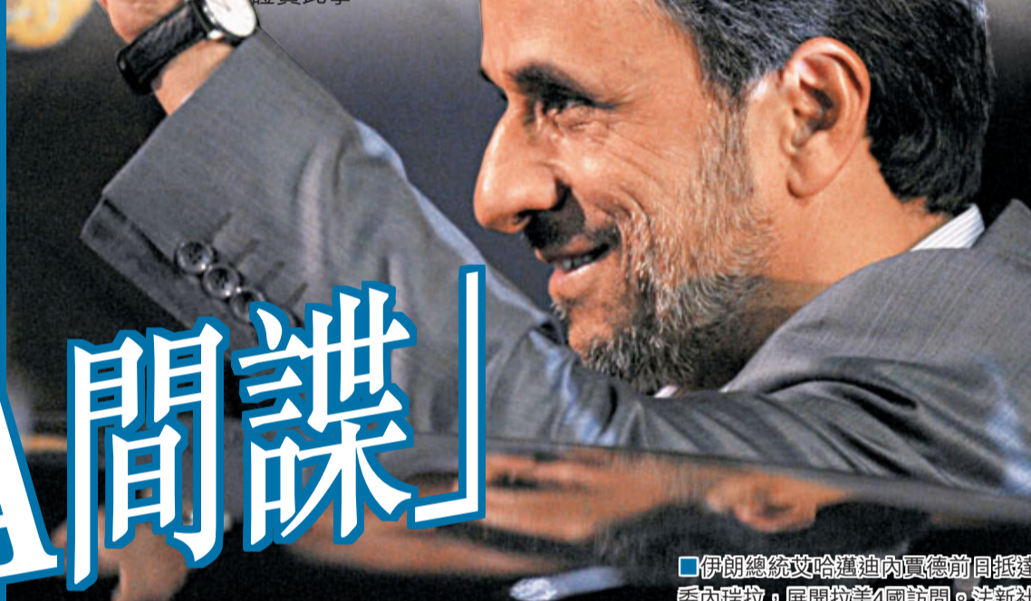
■伊朗總統艾哈邁迪內賈德前日抵達委內瑞拉，展開拉美4國訪問。

美國指伊朗發展核武而加強制裁，令兩國緊張關係升溫之際，伊朗法庭昨日判處一名被指是美國中央情報局(CIA)間諜的伊朗裔美國公民死刑，為美伊關係火上加油。美國防長帕內塔強調，伊朗發展核武和封鎖霍爾木茲海峽是美方的「紅線」，警告伊朗勿跨過。然而，美聯社引述外交人士稱，伊朗福爾多地下鈾濃縮廠已開始運作，製造純度達20%的濃縮鈾。伊朗電視台昨日也證實此事。