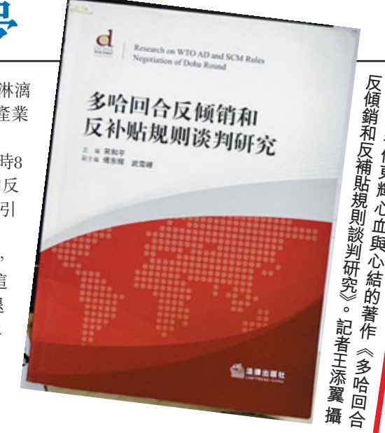
反傾銷和反補貼規則談判研究(多哈回合) 傅東輝著

此間，他參與了中國貿易救濟立法的起草，亦受商務部委託，主持了大量貿易救濟專題研究。在業務領域，他和他的團隊曾幫助25家企業在歐盟反傾銷中爭取到了市場經濟地位，為15家企業代理各國反傾銷案並贏得零