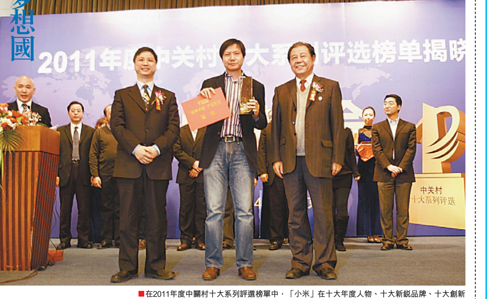
■在2011年度中關村十大系列評選榜單中，「小米」在十大年度人物、十大新銳品牌、十大創新成果、十大創投案例的四個榜單上均「榜上有名」，成為最大贏家。