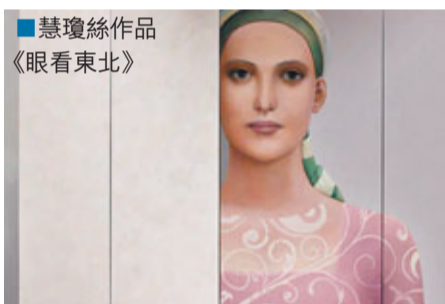
■慧瓊絲作品 《眼看東北》