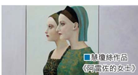
■慧瓊絲作品 《阿雷佐的女士》