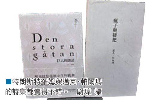
特朗斯特羅姆與邁克·帕爾瑪的詩集都賣得不錯。

外，關於中國的話題圖書，如邱成平解讀中國經濟的系列圖書、《中國農民工之歌》、《富士康輝煌背後的連環跳》等都有不俗成績。