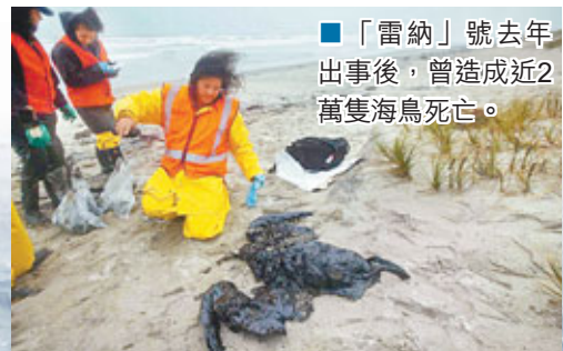
「雷納」號去年出事後，曾造成近2萬隻海鳥死亡。