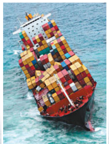
「雷納」號去年10月翻側時(上)與昨日的情況對比。法新社