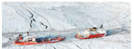
美國海岸防衛隊破冰船(右)帶領「倫達」號前進。

俄羅斯油輪「倫達」號運載燃料補給，上周五趕赴接濟美國阿拉斯加西北部城鎮諾姆期間，在白令海被厚達1呎的浮冰所困，雖然獲美國海岸防衛隊破冰船「希利」號開路，但每天只能前進5至6海里，還有300海里的冰要破，才可抵達終點。有3,500人口的諾姆因大風雪，使其冬季來臨前的最後一次補給受阻，鎮上燃料隨時用光，家庭、車輛、醫院和學校面臨斷電和暖氣。由於天氣太冷，冰一破便再極速形成，加上油輪要緊貼破冰船航行以免再被冰封，故造成潛在撞船危險，令航行緩慢。