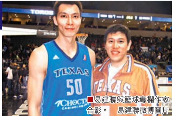
■易建聯與籃球專欄作家合影。