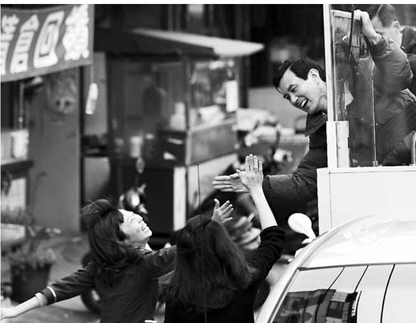
■馬英九(右)在雲林縣虎尾鎮車隊掃街，民眾開心與馬英九擊掌。

據台灣《聯合晚報》7日報道 「總統」大選進入倒數7天，國民黨、民進黨、親民黨三陣營7日分別在台南台灣短兵相接，進入巷戰的纏鬥局面。 蔡英文結束路竹造勢晚會後，趕往台南市造勢晚會，親民黨「總統」候選人宋楚瑜也在台南花園夜市舉行造勢晚會，宋蔡兩人分別在台南市海安路兩端先後造勢，宋楚瑜在選前最後一周闖入民進黨票倉造勢，搶票企圖心旺盛。蔡英文同一個晚上，分別在高雄與台南遭逢藍營與橘營夾擊，選戰熱度已到最高點。