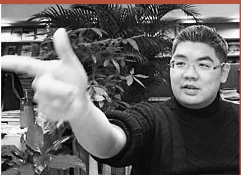
■國民黨中常委連勝文曾於5都選前輔選時遭槍擊，子彈貫穿面部至今留有疤痕(左圖)。右圖為他向記者憶述中彈經過。