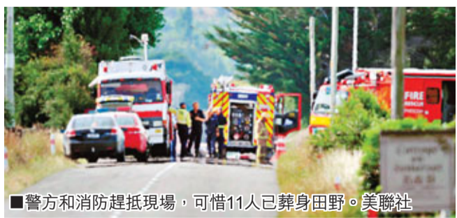
■警方和消防趕抵現場，可惜11人已葬身田野。