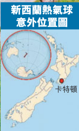
新西蘭熱氣球意外位置圖