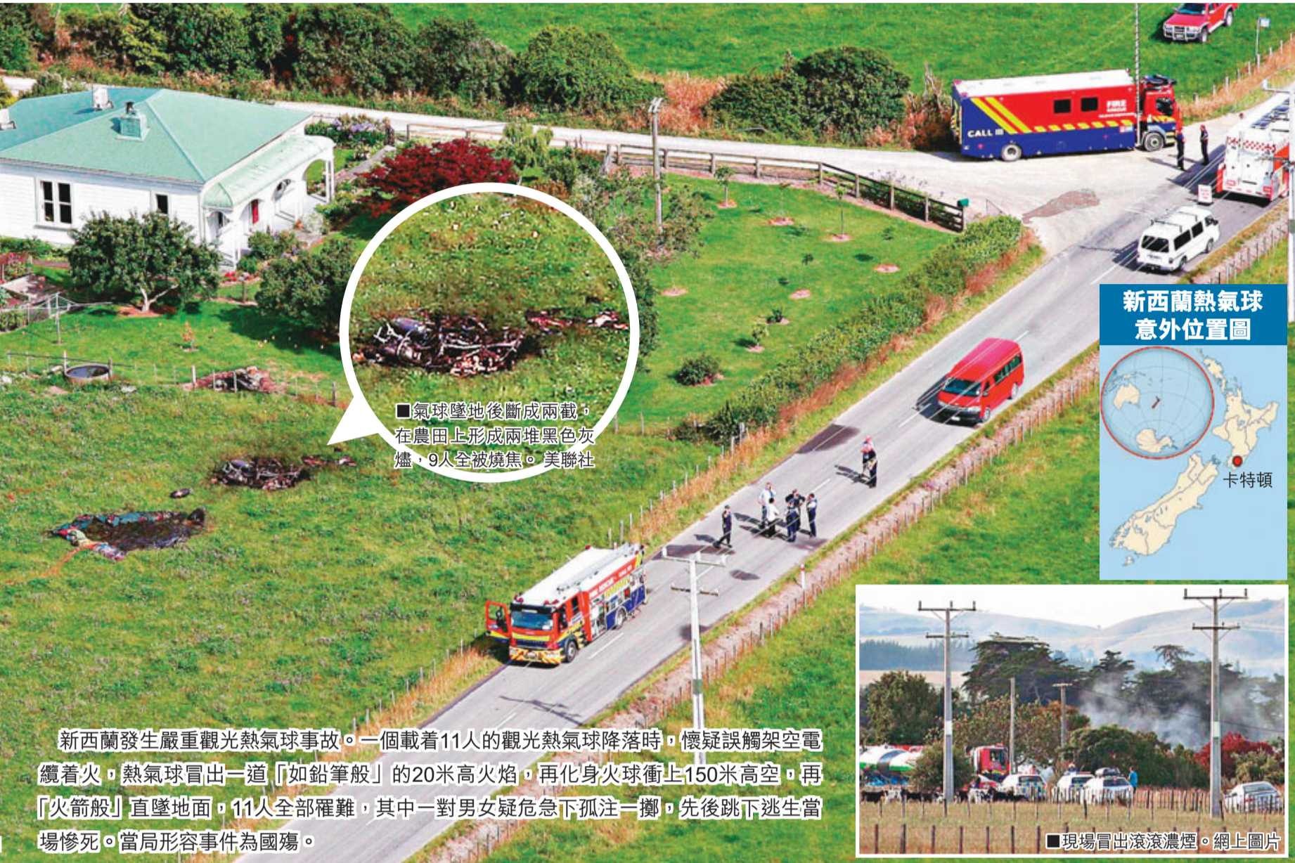
■氣球墜地後斷成兩截，在農田上形成兩堆黑色灰燼，9人全被燒焦。