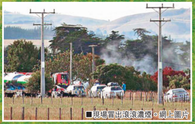
■現場冒出滾滾濃煙。

新西蘭發生嚴重觀光熱氣球事故。一個載着11人的觀光熱氣球降落時，懷疑誤觸架空電纜着火，熱氣球冒出一道「如鉛筆般」的20米高火焰，再化身火球衝上150米高空，再「火箭般」直墜地面，11人全部罹難，其中一對男女疑危急下孤注一擲，先後跳下逃生當場慘死。當局形容事件為國殤。