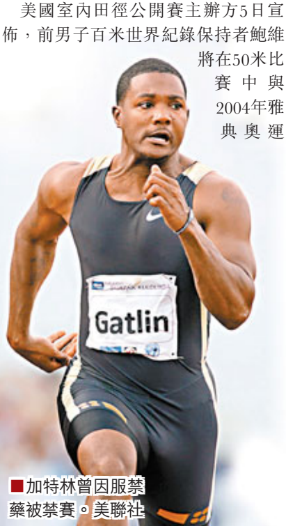
■加特林曾因服禁藥被禁賽。

美國室內田徑公開賽主辦方5日宣布,前男子百米世界紀錄保持者鮑維將在50米比賽中與2004年雅典奧運會百米冠軍加特林同場競技。這次比賽將於1月28日在紐約麥迪遜廣場花園舉行。這是鮑維自2004年以來首次參加室內比賽。他在2005年創造了9秒77的百米世界紀錄,但該紀錄被保特在2008年奧運會上打破。鮑維對記者表示,他有信心在倫敦奧運會的百米比賽中向保特發起挑戰,雖然他不喜歡室內比賽,但他希望能用這次比賽為奧運會盡早調整狀態。