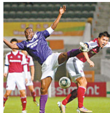
■公民法圖斯(左)與南華陳肇麒爭頂。

場上和氣收場場外卻上演火爆一幕,補時階段有球迷因不滿球證執法轉而向公民後備席洩憤,不斷大力拍打公民後備席廂與公民球員展開對罵,甚至完場後仍聚集於旺角場門口不斷高聲叫囂,有一名球迷被警方帶走問話,不過經訓示後已獲得釋放。