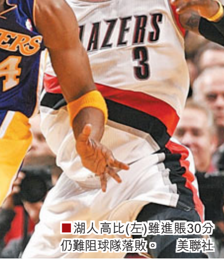
■湖人高比(左)雖連取30分仍難阻球隊落敗。