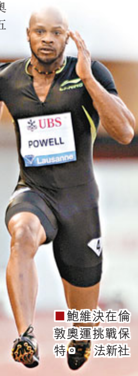
■鮑維在倫敦奧運挑戰保特。

加特林贏得了2005年世錦賽的100米和200米冠軍,但後來因為使用禁藥遭到四年禁賽,他也希望能在倫敦奧運會上重新證明自己。他在去年7月曾表示,自己的目標是登上倫敦奧運會的領獎台。「我不喜歡室內賽僅僅是因為每年的這個時候太冷了,」鮑維抱怨說,他已經八年沒有參加過冬季賽事了,「不過我認為在這個體育場我能跑得更快些。」