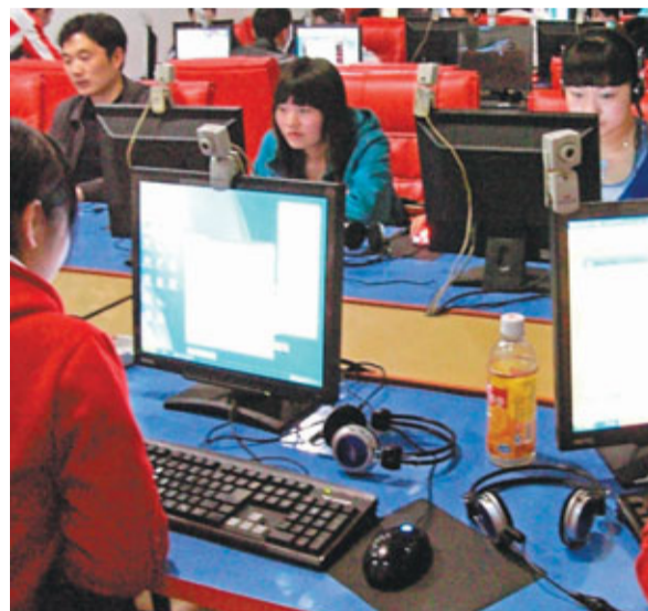
■很多網民都曾因微博虛假的謠言而受騙。