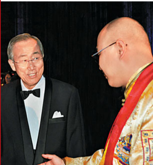
聯合國秘書長潘基文與祖古白瑪奧色仁波切會面

近日，聯合國紐約總部舉辦了「推動聯合國千年計劃·世界和平祈禱大會暨慶祝香港特區成立十五周年」大型新聞發佈會。大會共同主席包括聯合國友好協會主席布朗和首位任職於多個聯合國非政府組織的佛教領袖祖古白瑪奧色仁波切，以及大會主辦機構代表和聯合國代表等出席新聞發佈會。