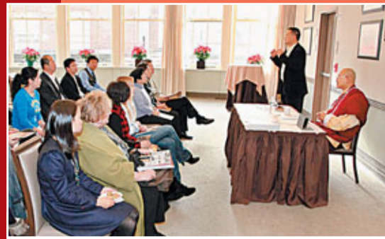
哥倫比亞大學佛學論壇演講現場