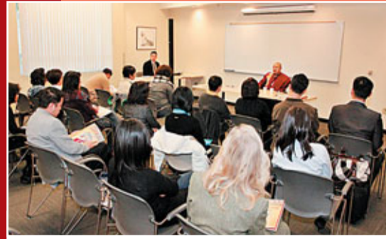
祖古白瑪奧色仁波切在加州洛杉磯大學演講