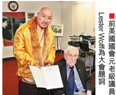
前美國國會元老級議員 Lester Wolf 為大會題詞