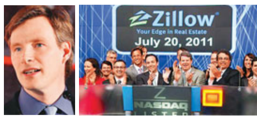
Zillow(右圖)選擇花旗集團承銷IPO，其中原因是看中馬哈尼(左圖)的影響力。

房地產網站Zillow於去年7月為首次公開招股(IPO)聘請華爾街銀行承銷，當中首選為花旗集團，最主要原因是花旗擁有一位星級科網股分析員馬哈尼。由於聘請花旗承銷，可望獲得馬哈尼給予其公司「建議買入」的評級，不少企業挑選承銷商時都會考慮這點，但有市場人士認為這有利利益衝突之嫌。