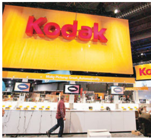
柯達業績下滑，或將申請破產保護。資料圖片

《華爾街日報》引述知情人士稱，20世紀全球最大的相機及菲林生產商柯達，可能於本月底或下月初申請破產保護。消息一出，柯達股價前日一度暴瀉33%，最終收報47美仙，跌28.2%。紐約交易所日前曾警告，若柯達股價持續6個月低於1美元，將被除牌。 據報，柯達現正作兩手準備，其一是繼續努力為1,100項數碼影像專利尋找買家，籌措約20億至30億美元(約155億至233億港元)資金。不過這批專利自去年7月掛售以來，一直無人問津，分析認為破產消息傳出後，成功出售的機會更是微乎其微。