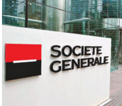
法國第二大銀行法興(見圖)前日宣布自願離職計劃，於4月起削減在法國的投資銀行部門共880個職位，佔投行僱員總數約7.3%，是繼上月撤換財務總監及投

行主管後再度「開刀」，也是法國銀行業最新的裁員行動。 法興在聲明中稱，今次計劃會優先安排內部調職，並以自願離職方式進行，同時會與工會磋商，零售銀行部門將不受影響。 受歐債危機拖累及監管機構提出更嚴格資本要求，法興及多間法國銀行相繼陷入資金荒，被迫縮減業務，引發裁員潮。法興早已計劃在亞洲及美國裁員700人，競爭對手法國農業信貸銀行上月亦削減2,350個投行業務職位，法國巴黎銀行則於去年11月宣布，將於企業銀行及投資銀行部門裁減1,396人，約佔整體人手6.5%。 ■路透社