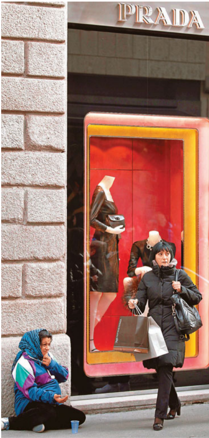
意大利經濟受歐債危機困擾，股市動盪。圖為一名女子在米蘭街市上行走。美聯社

索羅斯表示，目前危機是否會受到控制還不明朗，並警告許多投資者已認為危機超出可控制的範圍，是「無藥可救」，警告投資者在市場波動下謹慎投資。 ■彭博通訊社