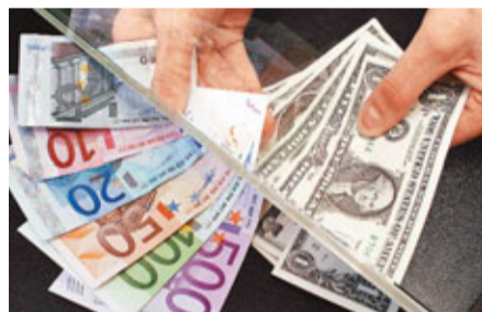
市場憂慮歐債危機，令歐元兌美元匯價跌至新低。

雖然美國最新就業數據理想，上週新申領失業救濟金人數為37.2萬人，較對上一周減少1.5萬人，少過市場預期的37.5萬人，但歐債危機憂慮繼續拖累大市，美股昨日早段跌逾百點。道瓊斯工業平均指數早段報12,314點，跌103點；標準普爾500指數報1,266點，跌10點；納斯達克綜合指數報2,636點，跌11點。 歐股方面，英國富時100指數中報報5,637點，跌31點；法國CAC指數報3,157點，跌36點；德國DAX指數報6,097點，跌13點。意大利及西班牙股市分別下跌3.71%及2.4%。