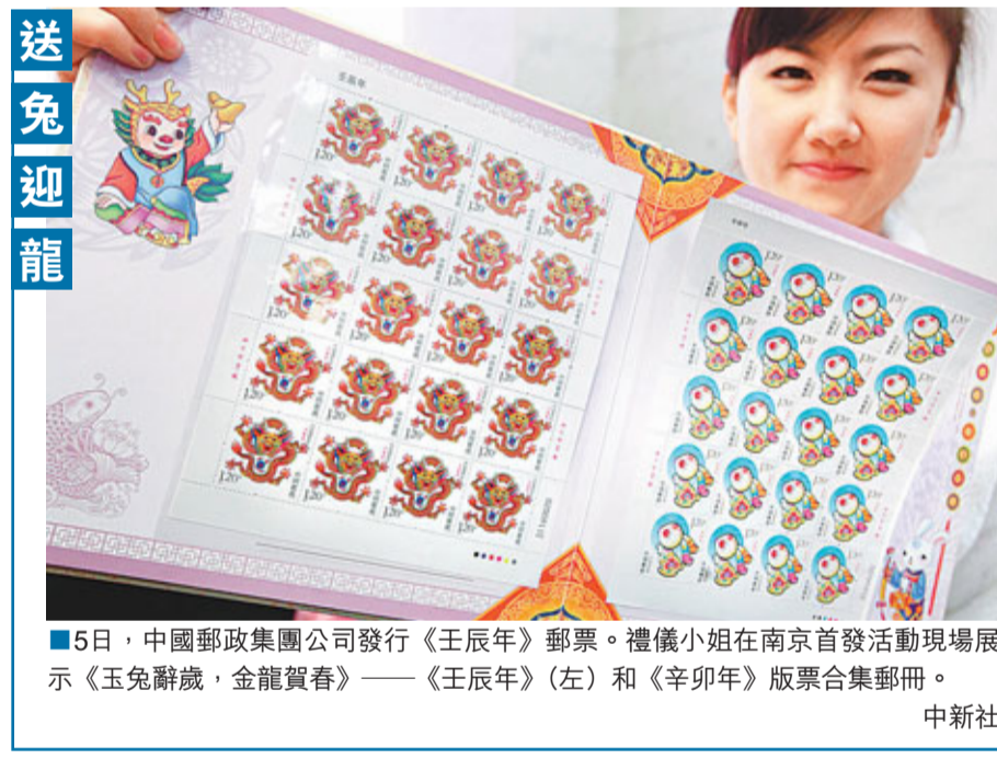
5日，中國郵政集團公司發行《壬辰年》郵票。禮儀小姐在南京首發活動現場展示《玉兔辭歲，金龍賀春》——《壬辰年》(左)和《辛卯年》版票合集郵冊。

多年來，北京一直在貿易談判中敦促華盛頓放寬對華高技術產品的出口，並表示這將有助於減少美國對華貿易逆差。