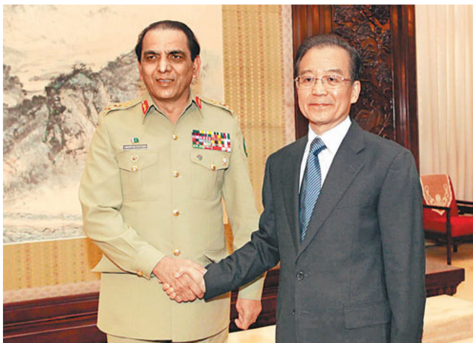
5日下午，中國國務院總理溫家寶在北京中南海紫光閣會見巴基斯坦陸軍參謀長基亞尼。

展望新一年，周邊外交在中國總體外交中的先後順序將大為提前。因為在「大國、周邊、發展中國家和多邊」外交先後次序中，周邊外交幾乎融合了所有大國關係，周邊外交與大國外交從來沒有像今天這樣如此緊密地結合起來，幾乎融為一體。