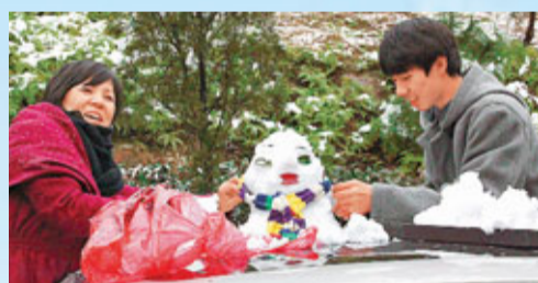
溫州昨日迎來今年首場大雪，市民紛紛上街玩雪。

貴州境內102省道梅花山路段全長16公里，海拔最高處達2,680米，該路段共有急彎24處，屬於危險路段。由於氣溫較低，梅花山大部分路段結冰，鐘山交警大隊梅花山巡邏中隊根據實際情況，從1月3日下午5時開始，對梅花山路段實行交通管制。