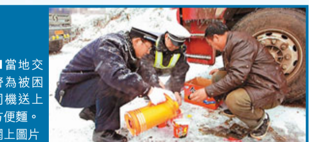
當地交警為被困司機送上方便麵。網上圖片

香港文匯報訊(記者前方貴陽報道)4日凌晨，在貴州省境內海拔2,600多米的102省道梅花山路段的路面結冰。10餘輛大貨車被困在此一天一夜之久。