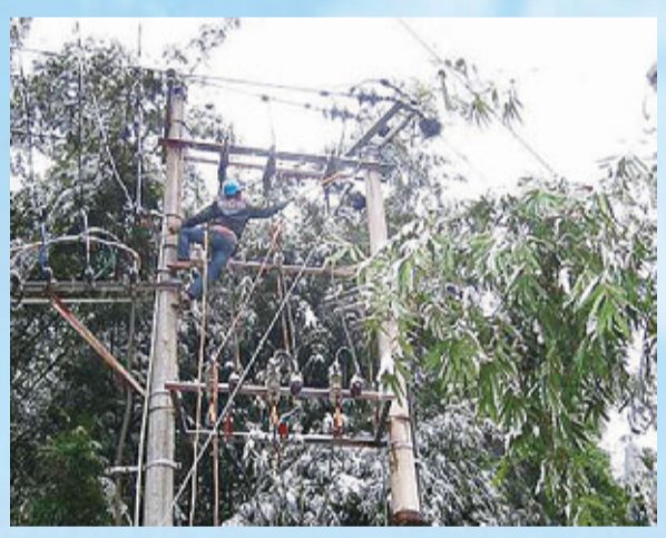
溫州電力人在搶修瑞安湖嶺10千伏電纜。

據了解，本次降雪未對溫州電網主網造成太大的影響，線路運行狀態良好，僅有少數積雪，未發現覆冰現象。浙江電網運行平穩，居民生產生活用電正常。