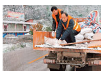
貴州烏當公路管理段龍洞堡養護站的隊員4日為公路撒工業鹽融冰。

香港文匯報訊(記者馬靜、前方北京、貴陽報道)貴州省甯海高速公路巴士車禍死亡人數昨日已增至18人，成為今年開年以來8宗特大交通意外中死亡人數最多