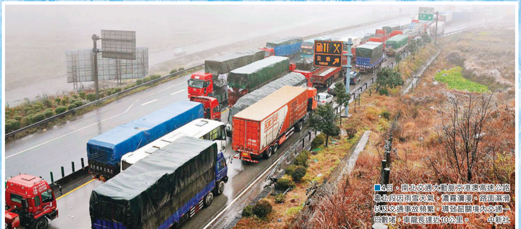
4日，南北交通大動脈京港澳高速公路北段因雨雪天氣、濃霧瀰漫、路面濕滑以及交通事故頻繁，導致韶關境內交通一團堵，車龍長達近10公里。