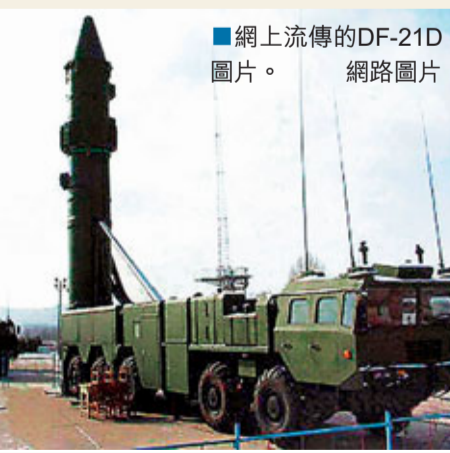
網上流傳的DF-21D圖片。

香港文匯報訊 據環球網援引日本《外交官》雜誌網站1日刊文，麻省理工學院海軍分析專家歐文·科特表示，「中國喜歡在1月11日有所行動。」指解放軍可能在1月11日測試東風21D反艦導彈（DF-21D）。