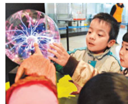
河南鄭州小朋友趁新年假日到市科技館體驗輝光球裝置。

在基因組和功能基因組、幹細胞與組織工程、轉基因動植物與克隆動物、神經生物學等方向培養造就30至50名國際一流創新人才及若干創新團隊；在生物醫藥、生物農業、生物製造、生物環保等領域培養造就領軍人才300至500名、學科骨幹3至5萬名；培養和造就30萬名生物產業人才；