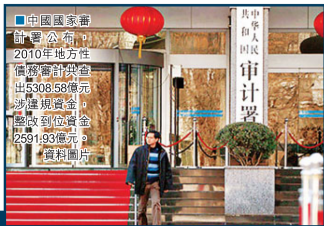
中國國家審計署公布，2010年地方性債務審計共查出5308.58億元涉違規資金，整改到位資金2591.93億元。資料圖片