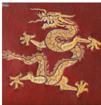
勞斯萊斯公司特別為中國龍年打造的特別版轎車。左圖為皮質靠枕上手工繡製的龍形圖案。

該公司2010年的全球汽車銷量超過以往任何一年，達到2.711輛，2011年的銷售情況還要更好。2010年勞斯萊斯轎車的最大市場依次是：美國、中國、英國、阿拉伯聯合酋長國、日本。