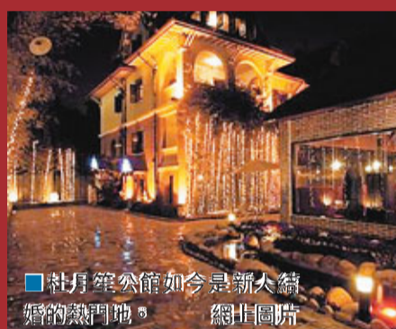
杜月笙公館如今是滬上熱門的婚宴熱門地。