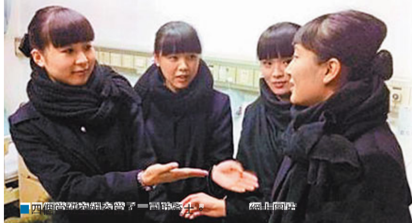
四個空姐充當助產士。網上圖片