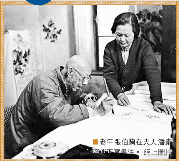
老年張伯駒在夫人潘薰陪同下看畫。