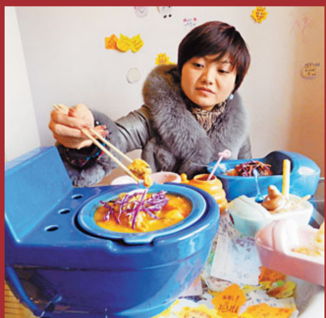
2日，一名年輕人在北京一家「馬桶主題餐廳」內就餐。這家「馬桶主題餐廳」裝修佈置類似洗手間，用形似馬桶的容器盛裝飯菜，吸引不少好奇的食客前來體驗。