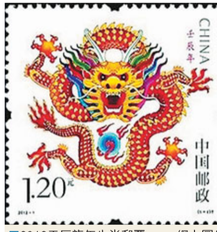
2012壬辰龍年生肖郵票。網上圖片

網友「大刀集郵」乾脆直接通過微博向設計者發問：「我怎麼感覺似曾相識，有點像1871年中國發行的第一枚郵票大龍郵票啊，只不過您這枚設計的龍票比