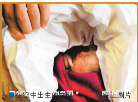
在空中出生的女嬰。