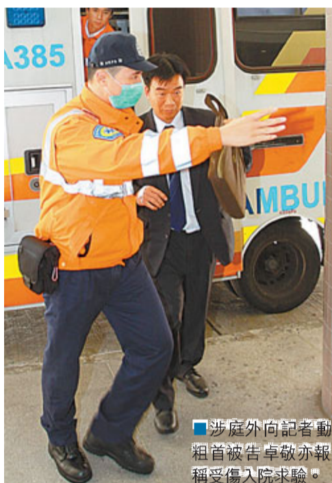
涉庭外向記者動手粗首被告卓敬亦報稱受傷入院求醫。

對於有攝影記者於採訪期間被襲受傷，香港攝影記者協會晚上發出聲明，對事件表示強烈關注，並對任何人在不合理情況下，阻撓合法採訪並襲擊攝影記者深表憤慨。