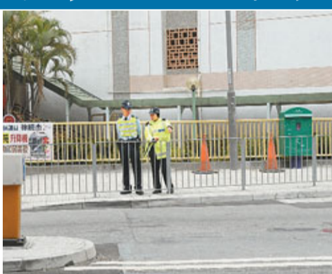
被貨車撞倒輾傷腳掌女子送院。

香港文匯報訊（記者杜法祖）青女昨晨發生嚴重車禍，居於青洲青華苑一名浸會大學副學士女生，擬到學生資助辦事處辦理申請資助手續，疑因心急會合母親趕搭巴士，在青康路橫過行人輔助線時，不幸被一輛大貨車撞倒，右腳掌更被車輪輾至血肉模糊重傷送院，日後恐有傷殘之虞。女生父親事後埋怨學生資助辦事處四度指其女兒填錯申請資料，要她一個月內多次頻頻往返，昨日第五次前往辦事處時終出事。警方現正調查意外原因，不排除女生心急橫過馬路肇事。