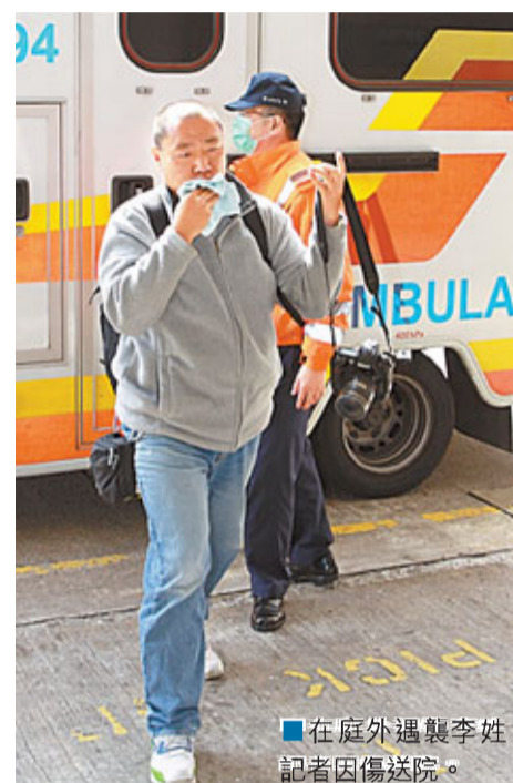
在庭外遇襲李姓記者因傷送院。