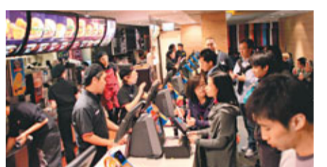
被盜善款箱放置在櫃位收銀機旁，相信竊匪是乘人多繁忙職員不留意落手。

警方接報到場翻看店內閉路電視，發覺其中一個捐款箱被一名戴眼鏡、穿深色衣服男子趁人多期間偷走，另一個則看不到被盜過程。麥當勞發言人表示，這些善款都是由善心人對病重兒童及其家人所獻出的支持及關心，對發生盜取善款之事感到遺憾，並在事發後報警。發言人並謂，麥當勞設有特定的保安程序，員工也需接受保安培訓。