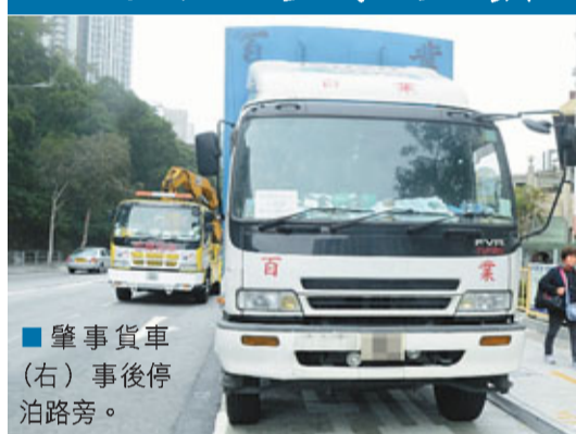
肇事貨車(右)事後停泊路旁。