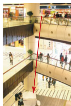
男子跳樓後受傷送院。

動，當聽罷電話後事主竟躍上約3呎高垃圾桶，繼而跨過4呎高欄杆一躍而下，直墮約30呎下商場1樓，當場重傷吐血倒地（見圖）。猶幸當時沒有遊人經過，無人被壓傷，但遊人驚見「空中飛人」飽受驚嚇。救護員接報趕到，將墮樓男子送院搶救。