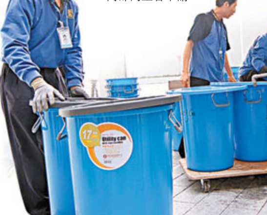
工人搬運多桶清水，準備清洗總部各次樓。

行政署署長麥綺明表示，署方已在上月28日發出電郵，通知職員有關事件，提供更新指引予職員作參考，以及設立熱線予職員查詢，至今已接獲17宗查詢個案。她指出，署方已在各樓層的茶水間裝上濾水器，洗手間及大堂亦設有酒精搓手液。另外，現時職員均如常上班，若因病需要請假，可向部門主管申請。